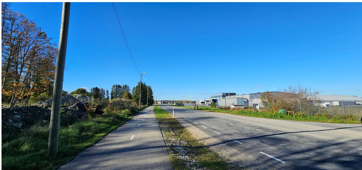
Vaade riigiteel nr 11505 kagust loodesse

Projekti koostamisel on arvestatud Eestis kehtivaid seadusi, standardeid, normdokumente ning juhendeid. Seadused on leitavad Elektroonilise Riigi Teataja kataloogist www.riigiteataja.ee , Standardid www.evs.ee ning juhendid Maanteeameti veebilehel rubriigist „Juhendid“ https://www.mnt.ee/et/ametist/juhendid .