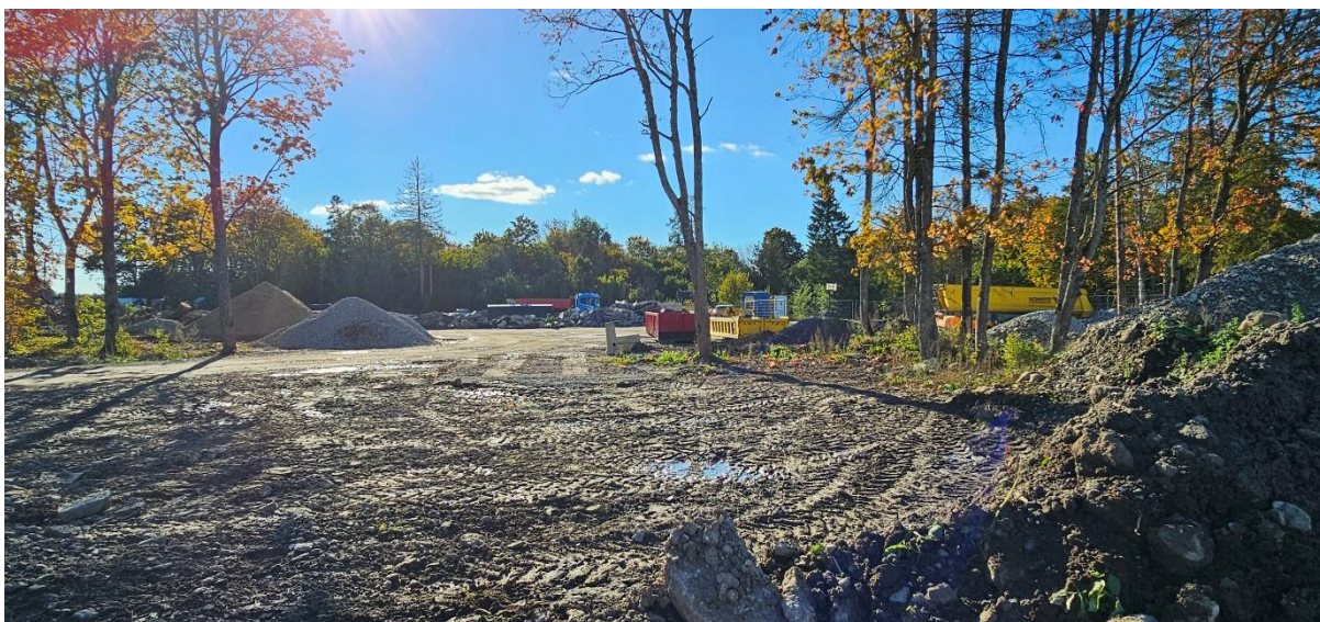
Foto: Vaade Kangru tee T3 rajatava mahasõidu asukohas (kirdest edelasse)