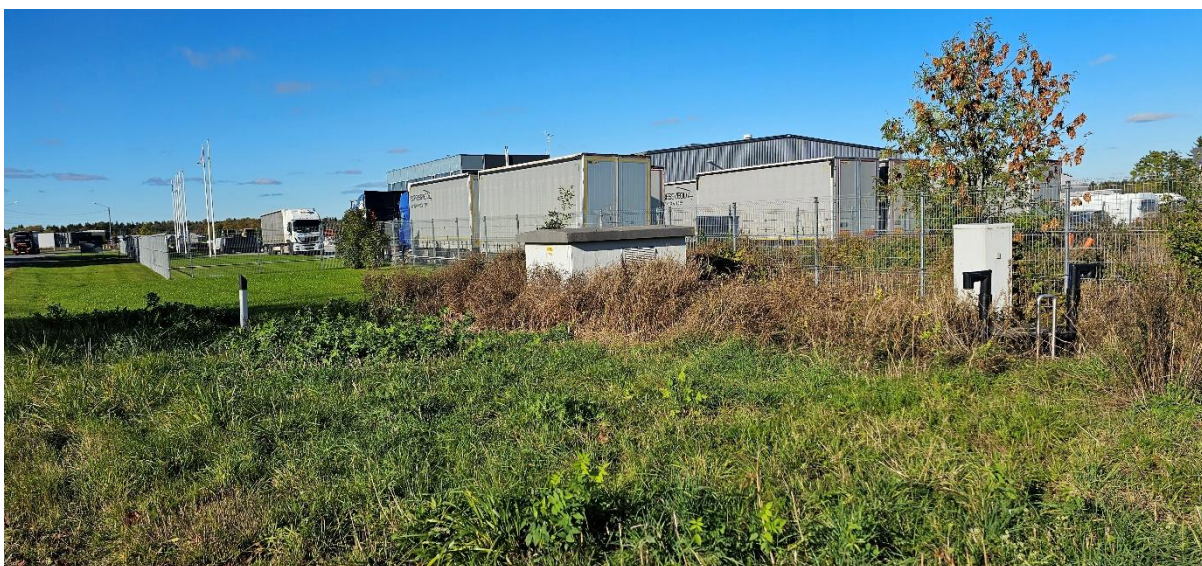
Foto: Vaade riigiteel nr 11505 ääres olevale Trummi alajaamale ja reovee ülepumplale