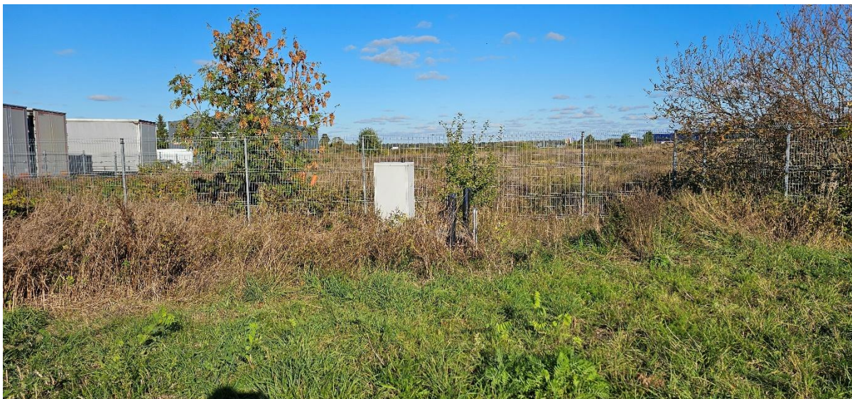
Foto: Vaade riigiteel nr 11505 ääres olevale reovee ülepumplale – vee- ja kanalisatsiooni liitumiskohtade asukohale (aia ääres)