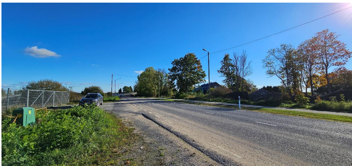
Foto: Vaade riigiteel nr 11505 loodest kagusse