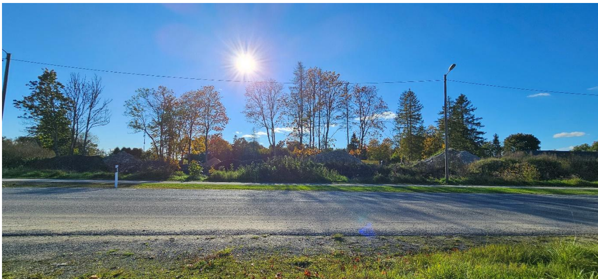
Foto: Vaade riigiteelt nr 11505 Kangru tee T3 rajatava mahasõidu suunas (kirdest edelasse)