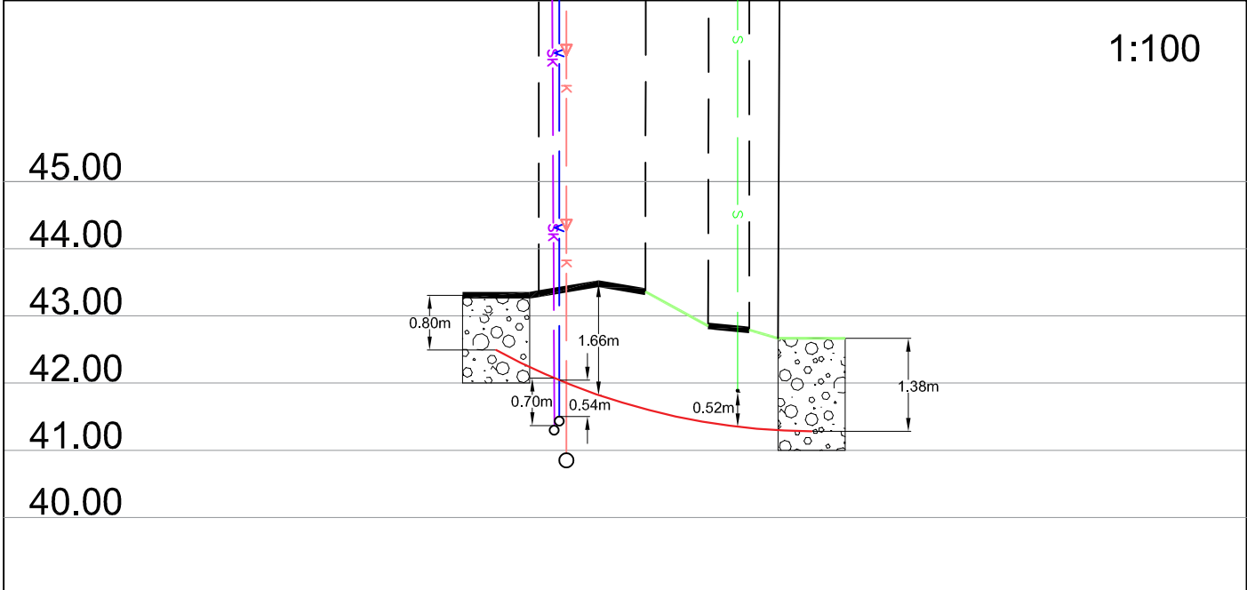
Ristumine 45 Tartu-Räpina-Väraska teega km-l 62,07