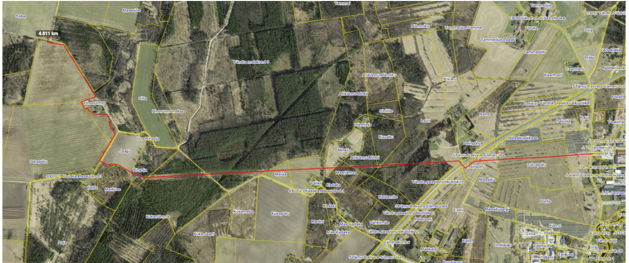
Joonis 1.1 Projekteeritud objekti asukohaplaan