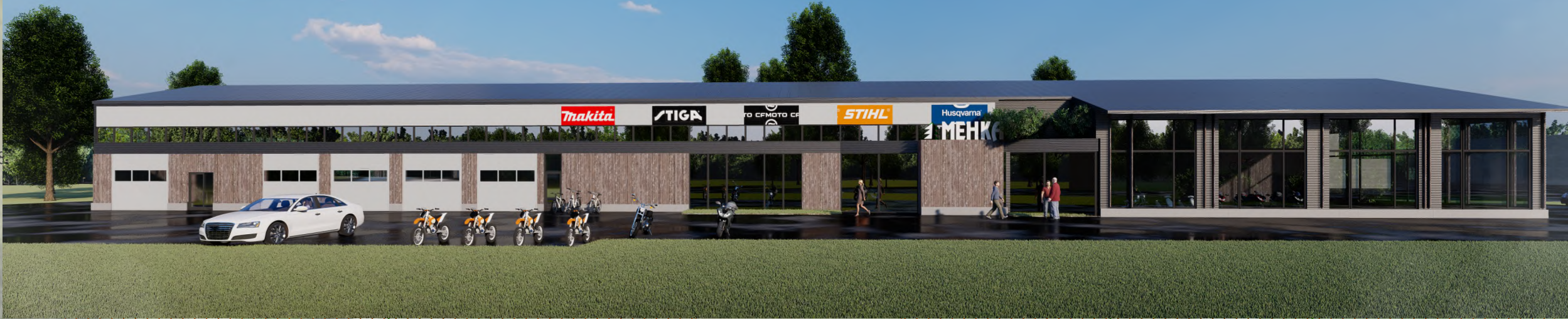
Illustratsioon vaatega Tln tänava poolt