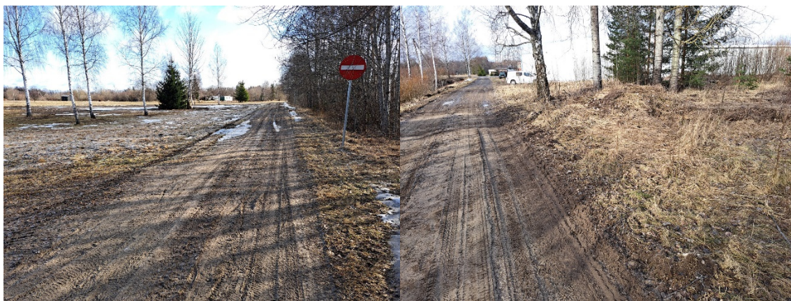
Fotod 5, 6 , Vaade Jussilepiku tänaval ida suunas ja lääne suunas

Töö nr 24-101-002, Teede ja liikluskorralduse projektiosa (TL), Staadium: PP