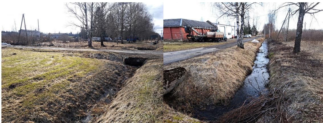
Fotod 3, 4, Vaade riigitee äärses teekraavis poole ja Jussilepiku tänava äärses kraavis poole