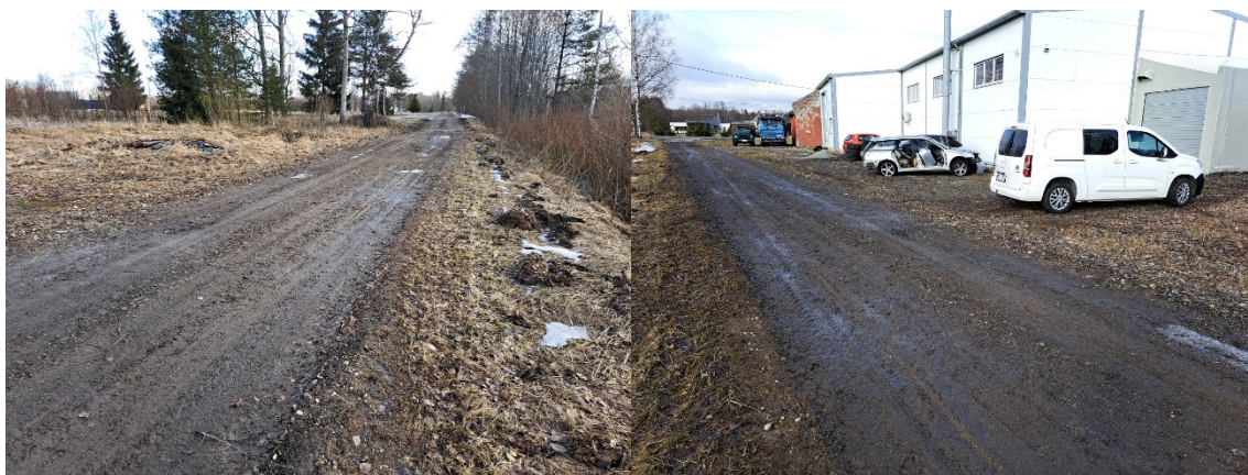
Fotod 7, 8 , Vaade Jussilepiku tänaval ida suunas ja lääne suunas