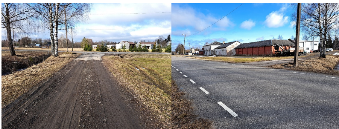
Fotod 1, 2, Vaade riigitee 19240 poole ja riigiteelt 19240 Jussilepiku tänava poole