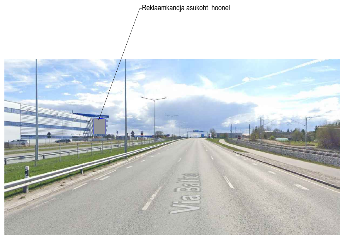
Vaade Pärnu mnt väljasõidul