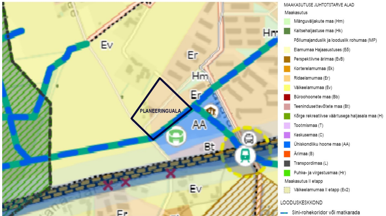
Joonis 2. Väljavõtte Rae valla põhjapiirkonna üldplaneeringust.