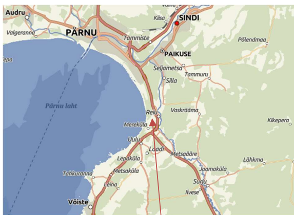
Joonis 1. Tööde piirkond.