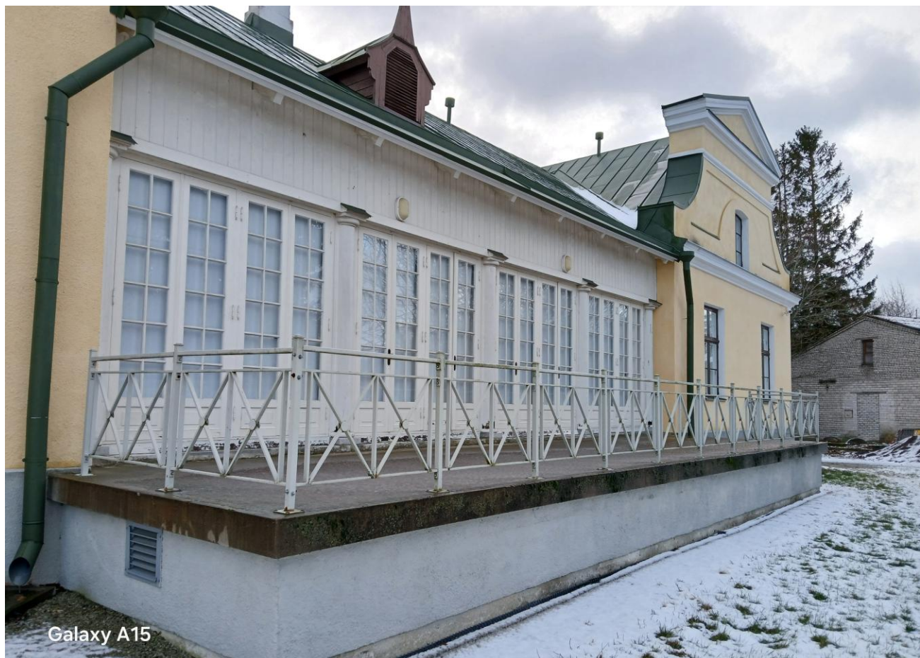
3. Ümberehitatav rõdu ja veranda.