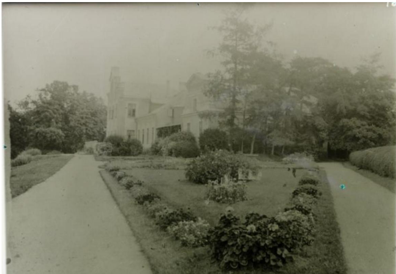
2. Klaasnegatiiv Viimsi mõisahoonest iluaiaga.