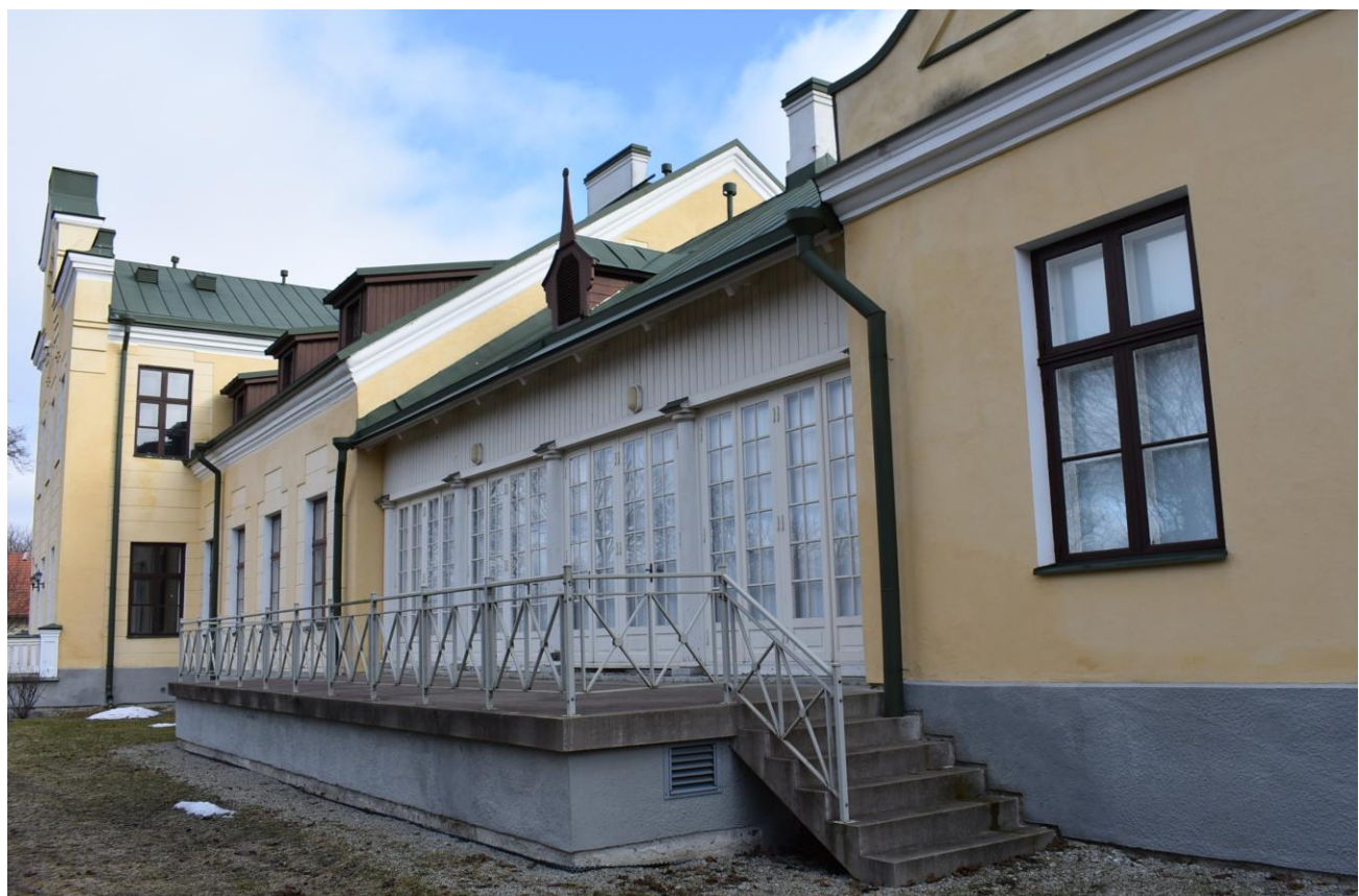
4. Vaade rõdule ja verandale edelast.

Viimsi mõisa peahoone (veranda). Muinsuskaitse eritingimused 2025. Lisad