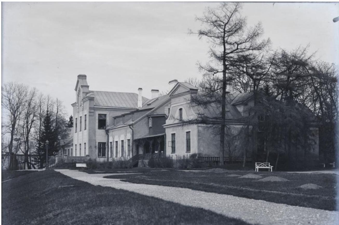
3. Viimsi mõisa härrastemaja, nurgavaade 20. sajandi algul.