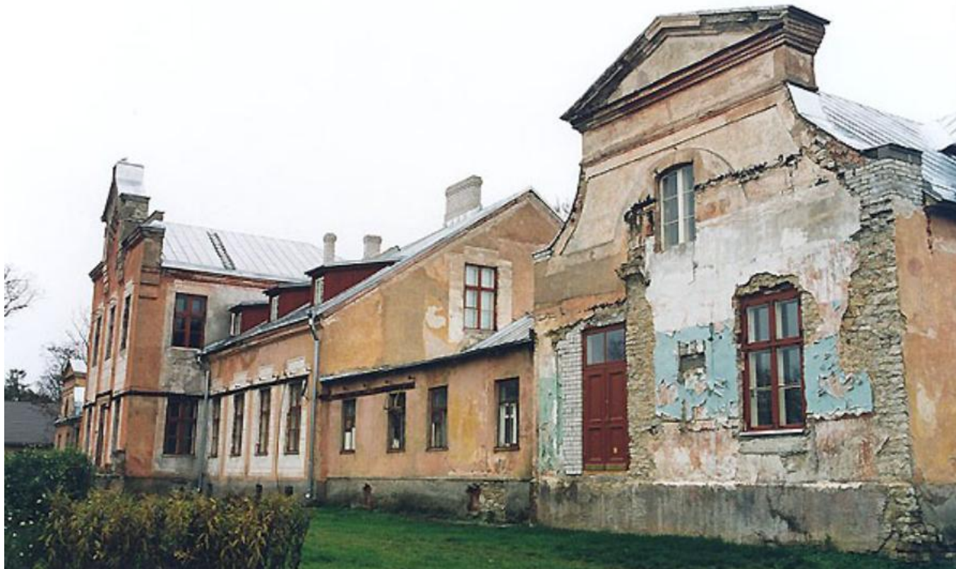
4. Vaade Viimsi mõisa peahoone tagaküljele. Foto: sügis 2001. Eesti mõisaportaál. Vaadatud: https://www.mois.ee/harju/viimsi.shtml