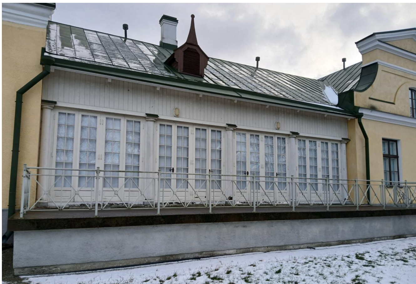
2. Ümberehitatav rõdu ja veranda. Vaade loodest.