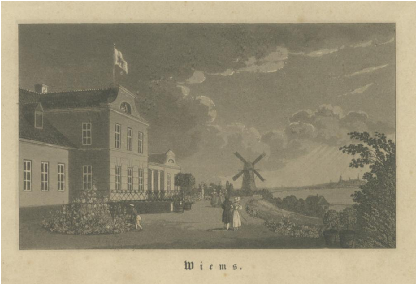
1. Viimsi lossi vaade. Graafika, Theodor Gehlhaar, 1833. vaadatud: https://www.muis.ee/museaalview/1196609