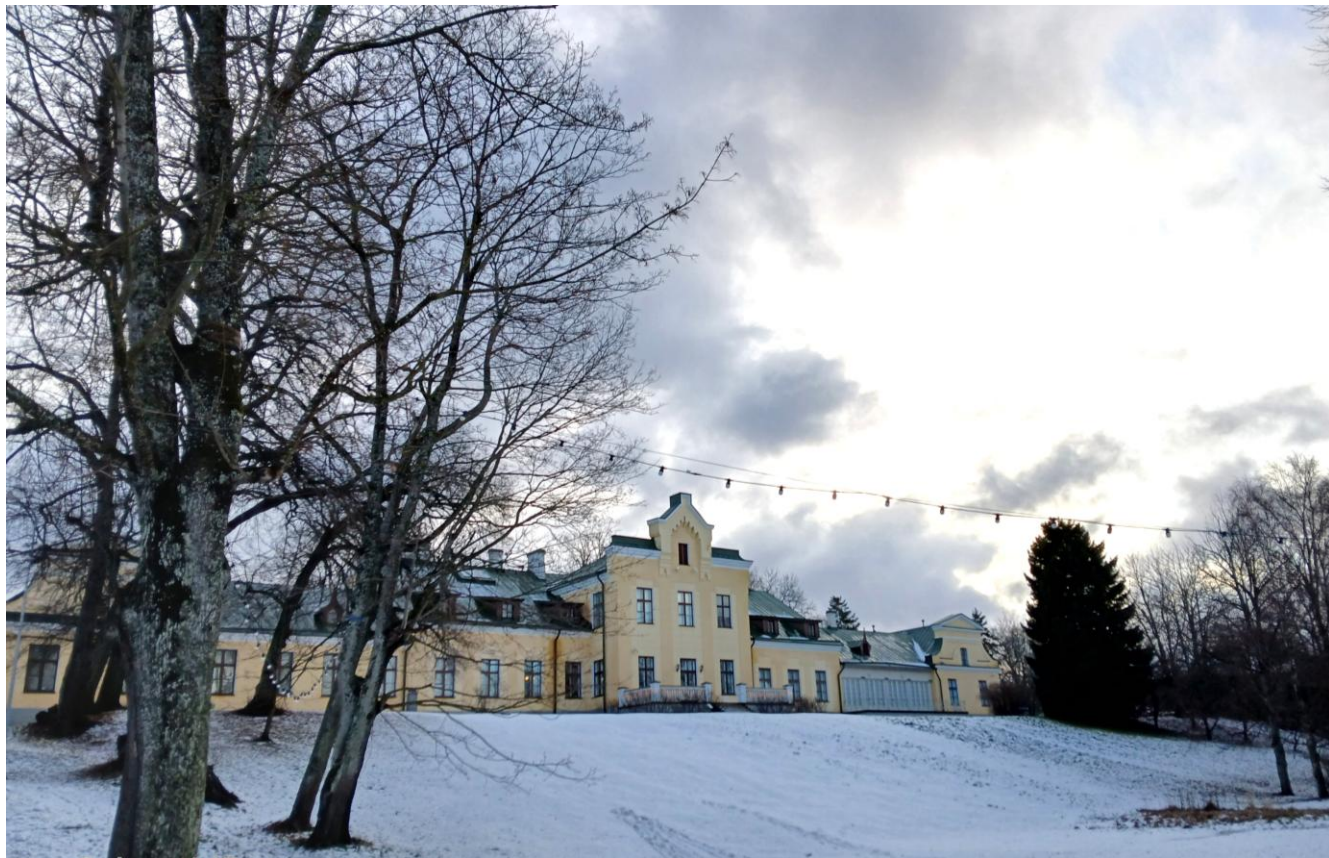
1. Viimsi mõisa peahoone (läänepoolne) tagafassaad. Vaade loodest.