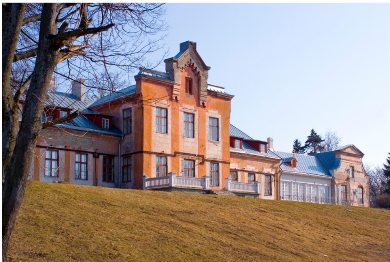
5. Viimsi mõisa peahoone 2007. aastal. Foto: Martin Siplane. Vaadatud: https://www.muis.ee/museaalView/2643200