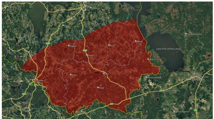
Joonis 2. Raadiosüsteemi Sommerfeldi tsooni 60 km-i piirjoon Kagu-Eestis piirangud päikesepaneeli võimsustele (25/50 kW) ning tuule elektrijaama labatipu kõrgusele maapinnast.