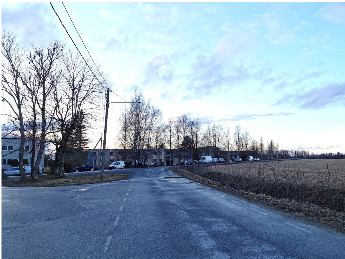
Fotod (3 tk): Päri tee, kahel esimesel fotol jääb projekteeritud jalgratta- ja jalgteede vasakule, viimasel paremale (põllu äärde)