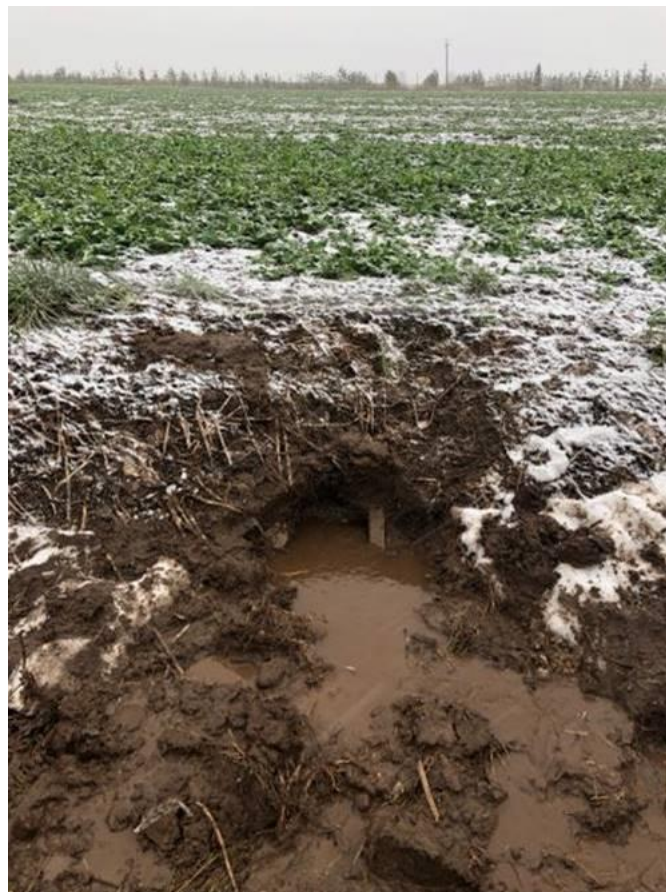
Fotod: Olemasolev дренаažisuue pk 15+60

Asendiplaanil näidatud puhastatavatest kraavidest on ette nähtud eemaldada sete ja hein (niita), prügi, võsa olemasolul ka see likvideerida. Setet eemaldatakse keskmiselt paarkümmend sentimeetrit. Kraavi põhi profileerida vee äravoolu kalde suunas, kraavi põhja profileerimisel jälgida projekteeritud truupide kõrgusi – truupide sisse- ja väljavoolu kõrgused peavad olema samad kraavi põhjaga. Kraavide vete voolusuund jääb samaks nagu ta on olnud. Projekteeritud jalgratta- ja jalgteele sadav vihmavesi on suunatud olevatesse kraavidesse, mille vahetus läheduses tee hakkab paiknema, varasemalt suundus pinnavesi projekteeritud tee asukohalt samuti kraavidesse.