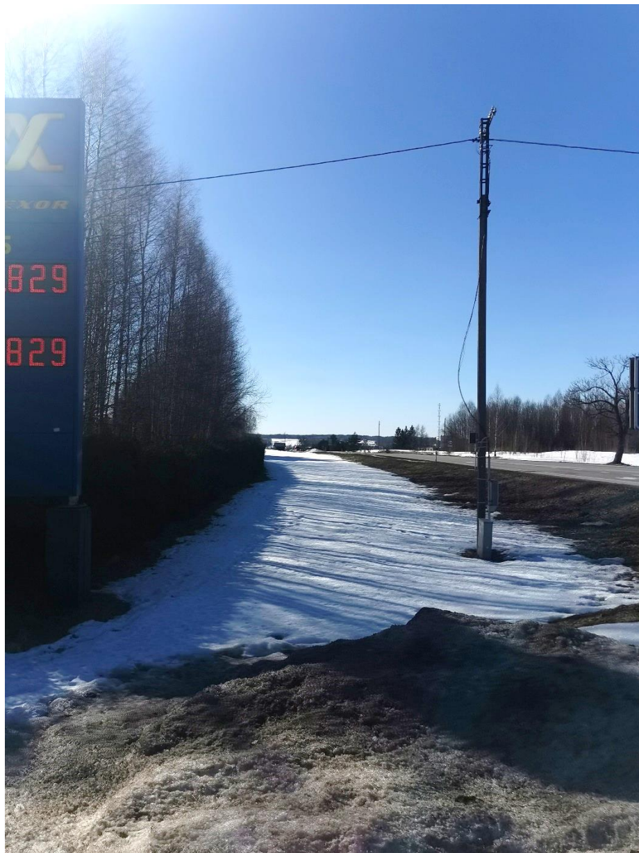
Foto: Riigitee nr 92 äärne lõik, vaade pk 2+40 poolt pk 0+00 poole.