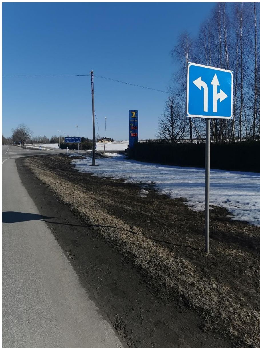
Foto: riigitee nr 92 äärne asukoht, vaade pk 2+00 pk 2+40 poole. Taamal paistavad ka olemasoleva jalgratta- ja jalgteede lõigu valgustipostid.