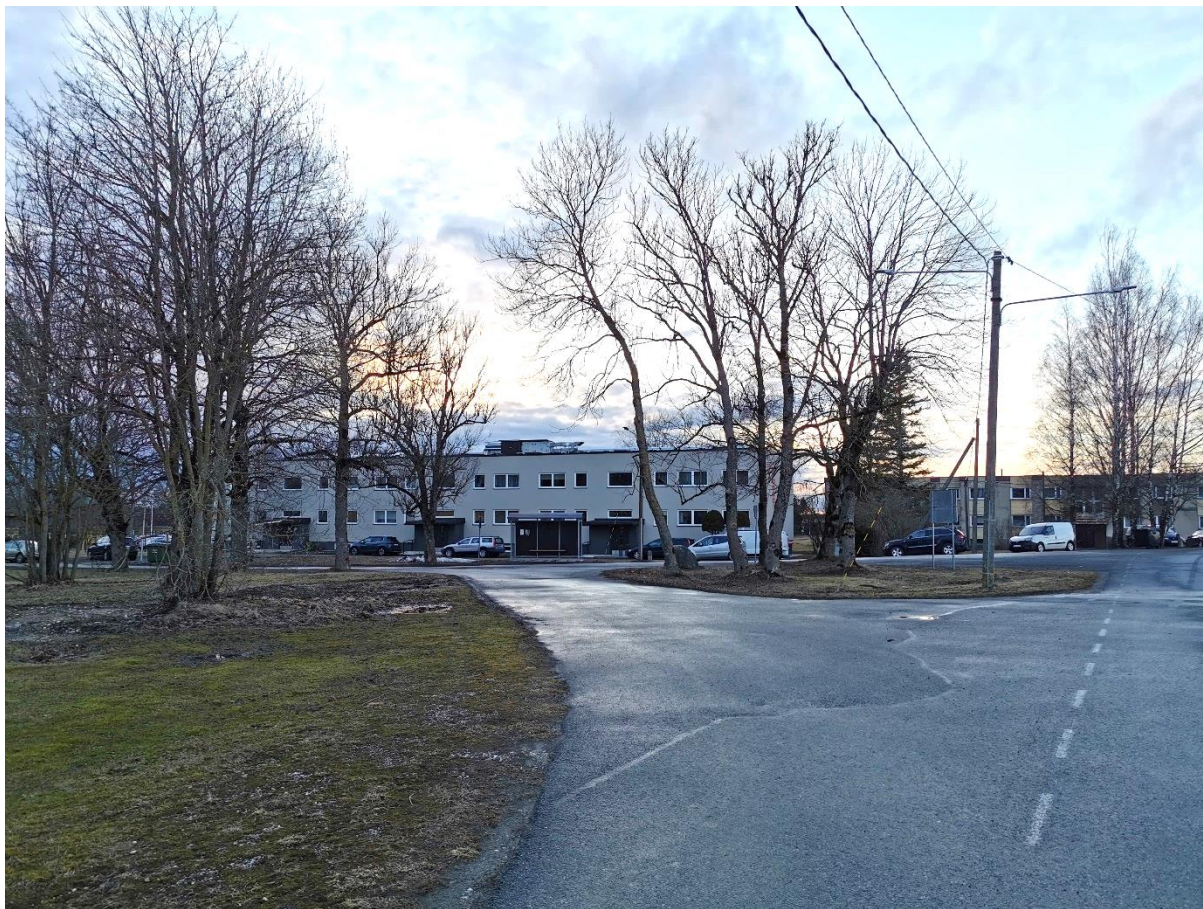
Foto: Projekteeritud bussipeatuse asukoht (ees vasakul) ning olemasoleva bussipeatuse asukoht (otse taga).

Tööde aegne ajutine liikluskorraldus tuleb kooskõlastada Transpordiameti Taristu ehitamise ja korrashoiu lääne üksuse liikluskorraldajaga.