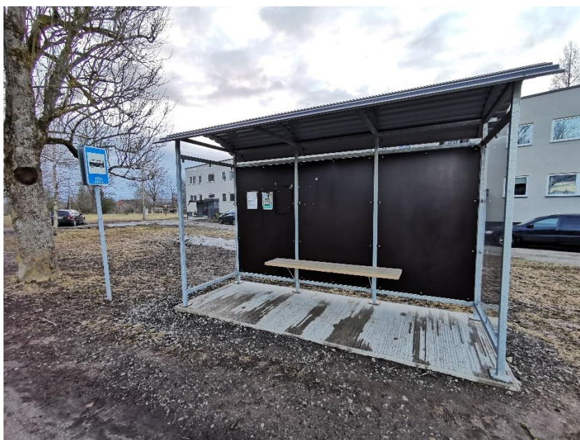
Foto: Olemasolev bussipeatus

Päri tee 18 elamu eest tõstetakse bussipeatus spordikooli kinnistule Kannikmäe tee 19. Tõstetakse ka bussiootepaviljon ning bussipeatuse nimega liiklusmärgid nr 541a. Bussipeatus tuleb ümber tõsta koos betoonalusega. Kui betoonalust ei õnnestu tervena uude asukohta paigaldada, tuleb valada või paigaldada uus samade mõõtudega ja samaväärne betoonalus.