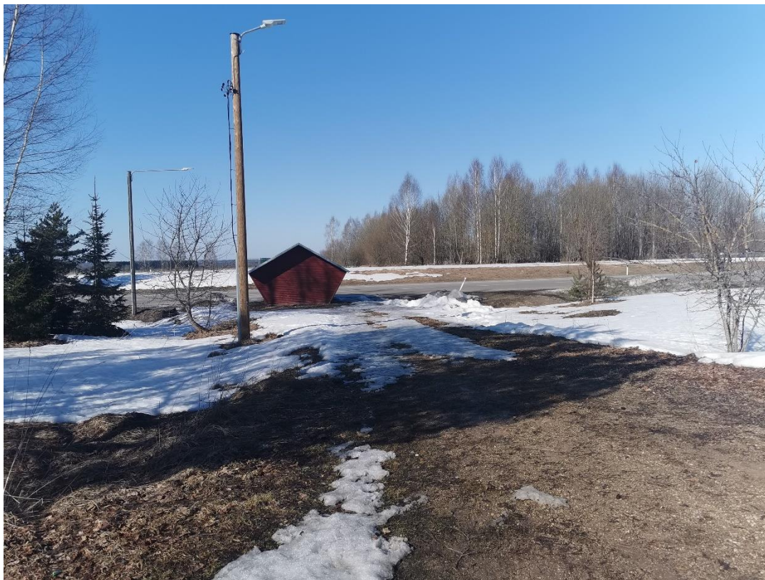
Foto: vaade Lennuvälja bussipeatuse poole. Fotel näha olevast valgustipostist võetakse ka käesoleva projekti raames projekteeritud tänavavalgustusele toide. Vaade pk 100+35 poolt pk 100+00 poole.