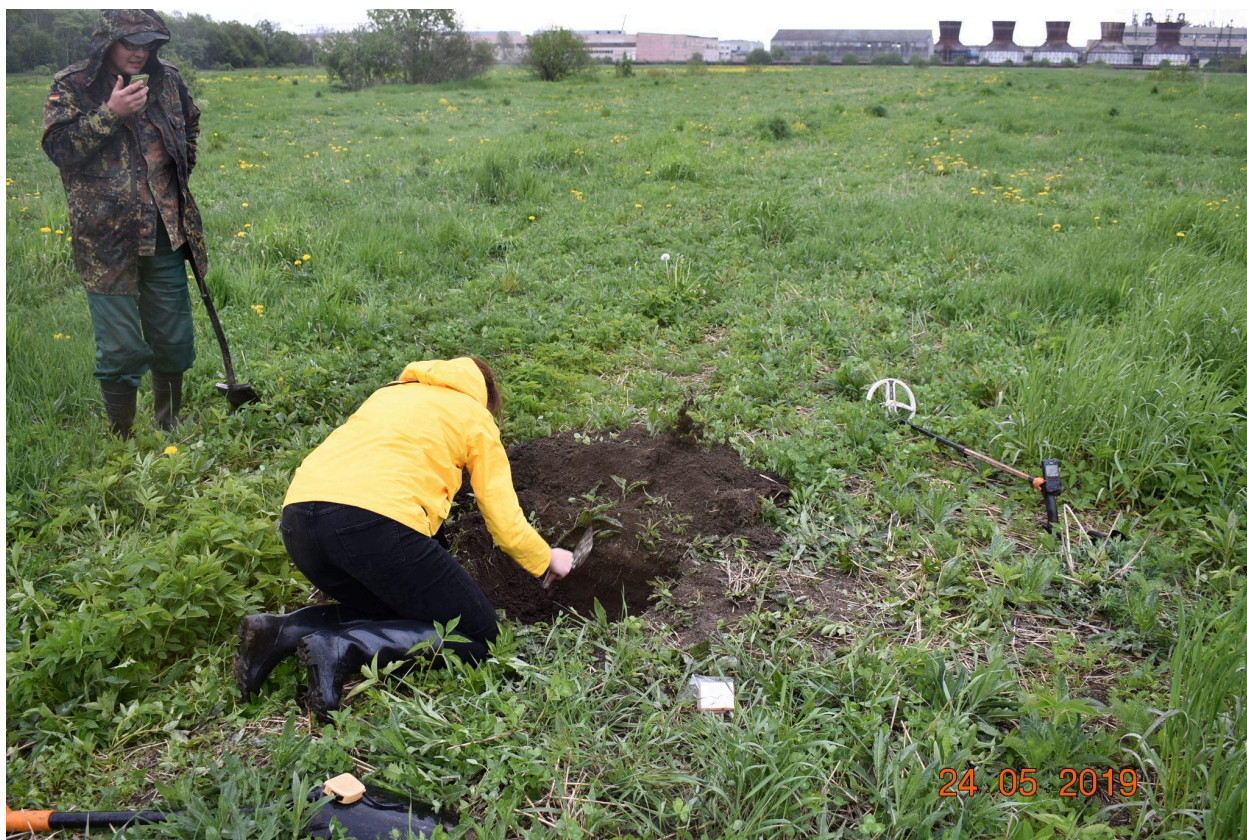
Foto 1. Vaade leiukohale loodest, šurfi 1 kaevamine Suterma KÜ lõunapoolne osa.

2019. aasta kevadel olid hobiotsijad avastanud katastriüksuselt mõned rauast arheoloogilised leiud, jätsid need esialgsesse leiukohta ja teavitasid nendest MKA-d. Leiukoha ülevaatusel avastatud leiud (ja lisaks need leiud, mis olid avastatud varem ja jäetud oma esialgsesse leiupaika) on MKA-le üleantud arheoloogiliste leidude üleandmise-vastuvõtmise aktiga 5.1-15/147 (2019) 1 . Leiunimekiri koos koordinaadi punktidega on lisatud leiuahtile.