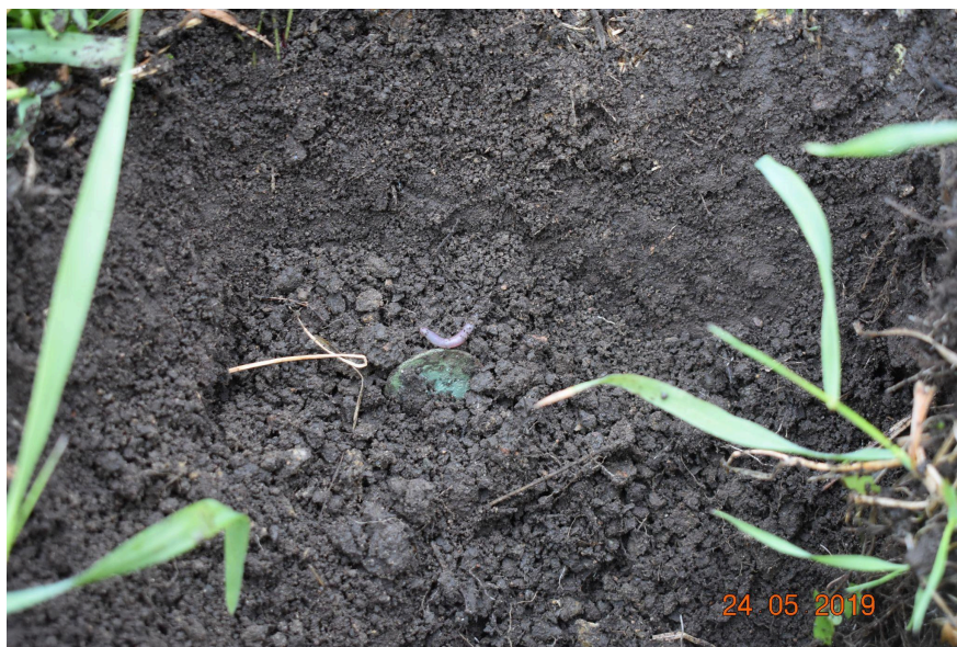
Foto 9. Rootsi münt leiukohas.

Leiukoha ülevaatusel järel olid hobiotsijad MKA loal 2019. aasta kevad-suve veel leiukohas käinud ja andnud leiud üle leiuahtiga 5.1-15/146 (2019).