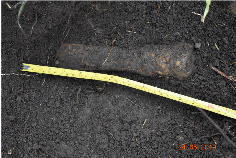
Foto 8. Õõskirves leiukohas.

Suterma KÜ ja Kohtla metskonna 156 katastriüksuste piiril leiti sügavusel 30 cm maapinnast veel üks õõskirves, mis ei kajastu leiuakti leidudenimekirjas. Selles kohas oli pinnas soisem kui mujal, arvatavasti sellepärast, et kuivanduskraavid selle kohani ei ulatu. Koordinaatdipunkt 1792.