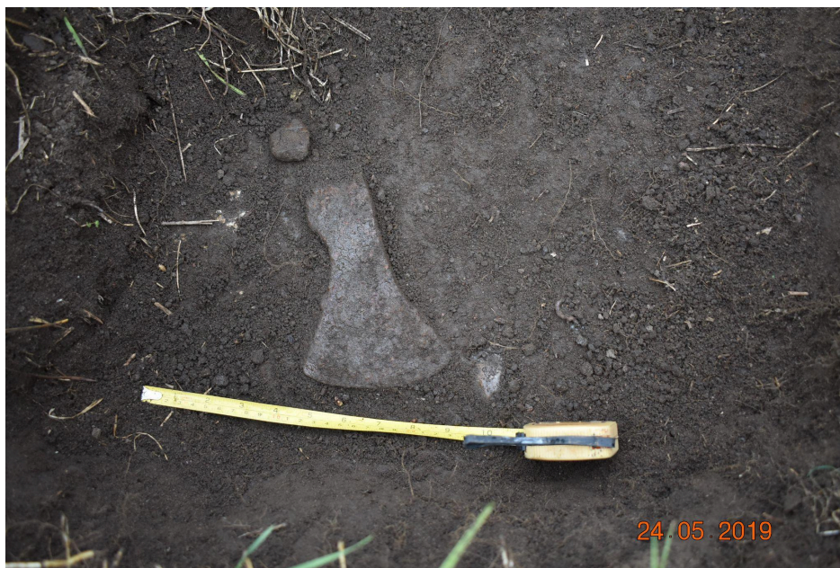
Foto 7. Kirves (aktis leid nr 11) leiukohas. Koordinaadipunkt 1788.