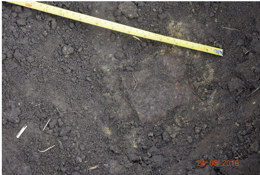
Foto 4. Tänapäevane raudese šurfis 3.

Kirjeldus: kamara all 30 cm ühtlast hallikat-pruunikat künnikihi mulda, selle all kollane liivane aluspõhi. 20. sajandist pärit raudeseme katke paiknes looduslikualuspõhja peal (fotod 4 ja 5). Leid võeti üles ja puhastati sisetingimustes. Leidu ei akteeritud, kuna selgus, et tegu on tänapäevase esemega.