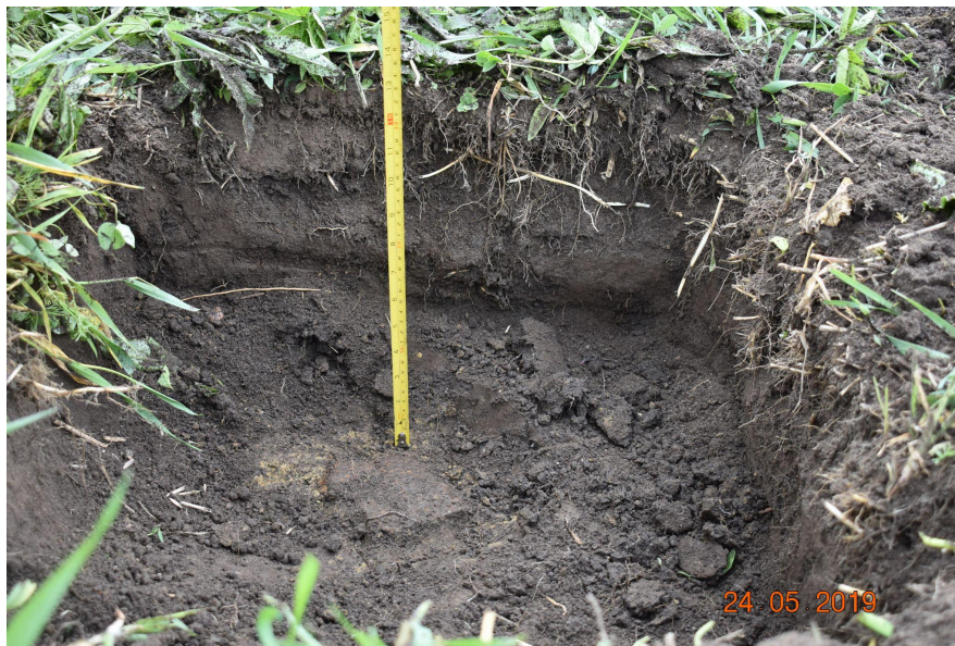
Foto 5. Šurfi 3 profiil.

Liikusime katastriüksuse piires põhja poole. Hobiotsijad otsisid uusi raua signaale, millele võtsime punkte ja pildistasime osasid leide. Kuna pinnas oli enamjaolt sama: 30-40 cm kamaraalust pruunikat-hallikat ühtlast künnikihi mulda loodusliku pinnase peal, siis uusi šurfe me enam ei kaevanud ja ei dokumenteerinud.