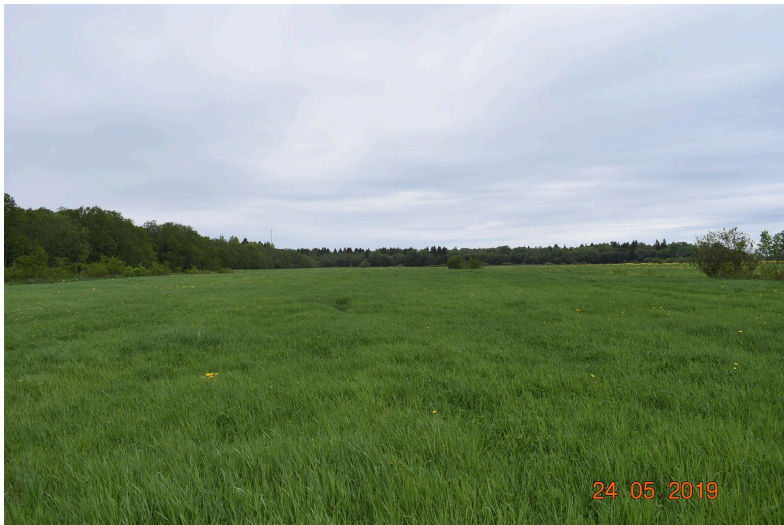
Foto 6. Leiukoht. Suterma kinnistu põhjapoolne osa. Vaade kagust.