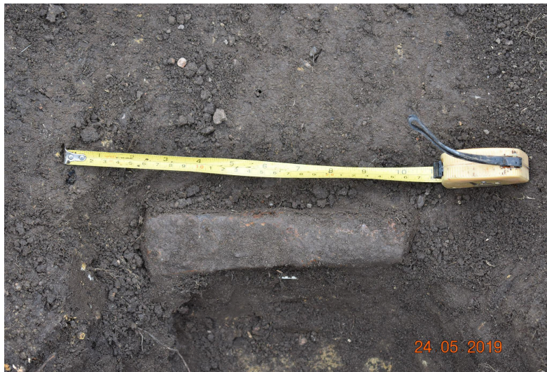
Foto 2. Õõskirves šurfis 2. Leiukoha ülevaatusel eelnenud otsingu käigus olid leidjad oli signaali peale kaevanud, eseme puhastanud, jätnud oma esialgsesse leiukohta ja augu kinni kaevanud. Leiukoha ülevaatusel käigus sai auk taasavatud, laiendatud ja eseme algne leiukoht fikseeritud.

Kirjeldus: kamara all oli 40 cm ühtlast hallikat-pruunikat künnikihi mulda, selle all kollane liivane aluspõhi. Õõskirves (leiuakti lisas leid nr 10) paiknes hallikas-pruunikas künnikihis 30 cm sügavusel maapinnast (fotod 2 ja 3).