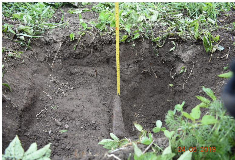
Foto 3. Šurf 2, profiil. Õõskirves oma esialgses leiukohas, eseme äärest kaevasime sügavamaks, et näha, kust algab looduslik aluspõhi.

Foto 2. Õõskirves šurfis 2. Leiukoha ülevaatusel eelnenud otsingu käigus olid leidjad oli signaali peale kaevanud, eseme puhastanud, jätnud oma esialgsesse leiukohta ja augu kinni kaevanud. Leiukoha ülevaatusel käigus sai auk taasavatud, laiendatud ja eseme algne leiukoht fikseeritud.