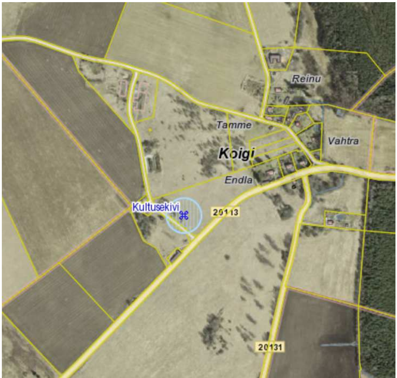
Joonis 4.1. Arheoloogiamälestis nr 12174.