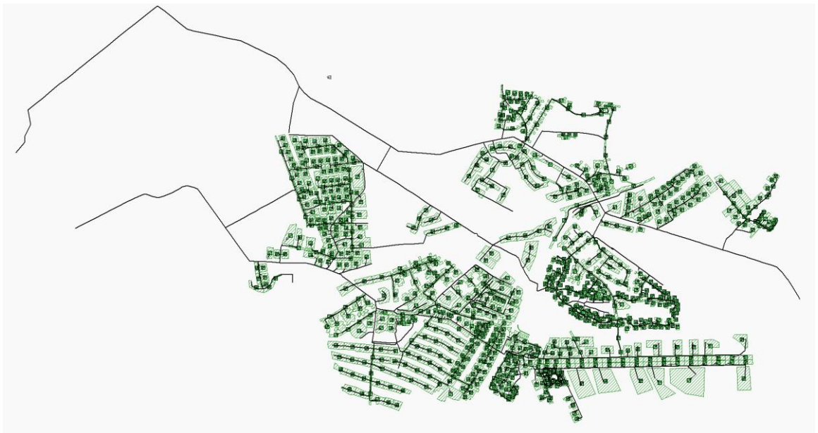
Skeem 2. Sademevee mudeli skeem

Arenduselt kolmas väljavool on Pendipõllu kinnistu peale rajatava varumahu kraavi kaudu Kaoiduvahe tänava otsas paiknevasse kraavi. Pendipõllu kinnistule on projekteeritud varumahukraav, mille mahutavus on ca 1000 m 3 . Ühendus olemasoleva kraaviga on tehtud De250 truubitoruna. Olemasolevasse kraavi arenduselt juhitud maksimaalne vooluhulk on 78 l/s. Olemasolevad kraavid sobivad antud vooluhulga vastu võtmiseks.