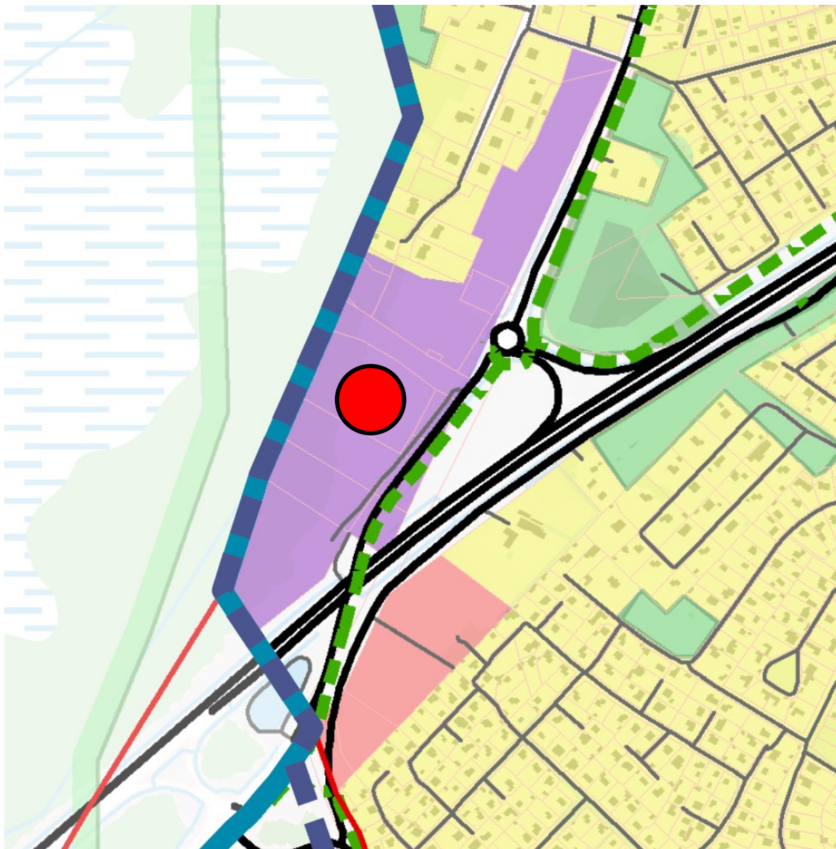
Joonis 2: Väljavõte koostatavast Kiili valla üldplaneeringust

Kiili valla koostatava üldplaneeringu järgselt on Papi ja Papimetsa katastriüksuste maakasutuse juhtfunktsioon tootmise maa-ala. Planeeringuala asub tiheasustusalas.