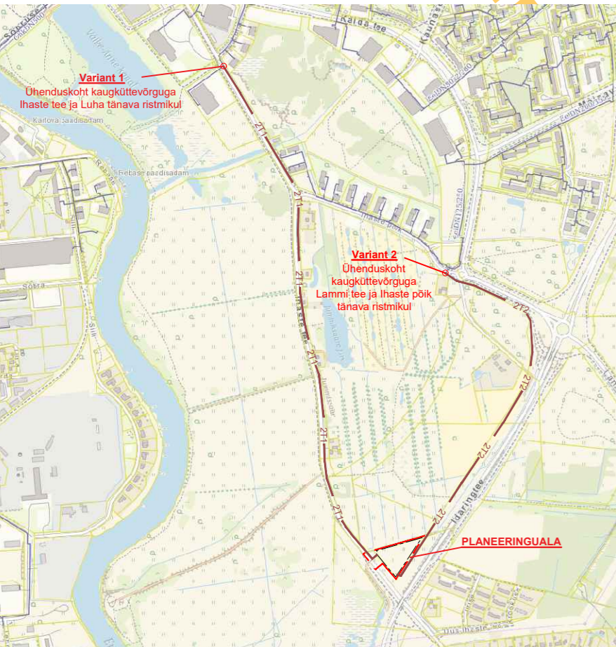
SKEEM 2. Planeeritud kaugkütte trasside põhimõtteline skeem väljaspool planeeringuala