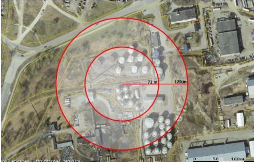
Joonise märkus: Raudtee estakaadil koordinaadid L-EST süsteemis: X: 6591141.4, Y: 556888.4