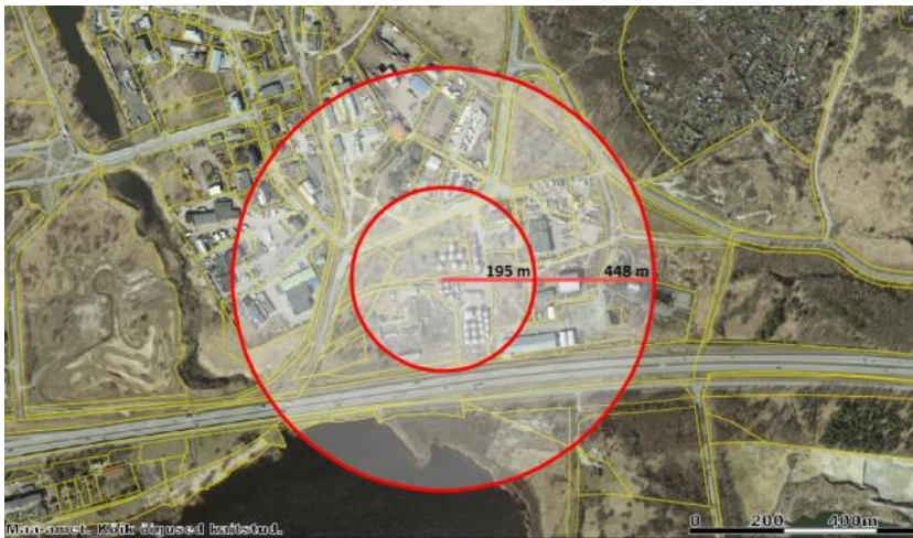
Joonise märkus: Raudtee estakaadil koordinaadid L-EST süsteemis: X: 6591141.4, Y: 556888.4