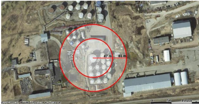
Joonise märkus: Mahuti nr 17 koordinaadid L-EST süsteemis: X: 6591066.4, Y: 556942.6