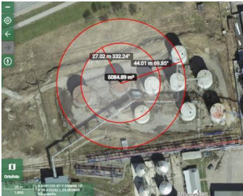
Joonise märkus: Mahuti nr 5 koordinaadid L-EST süsteemis: X: 6591188.44, Y: 556868.17