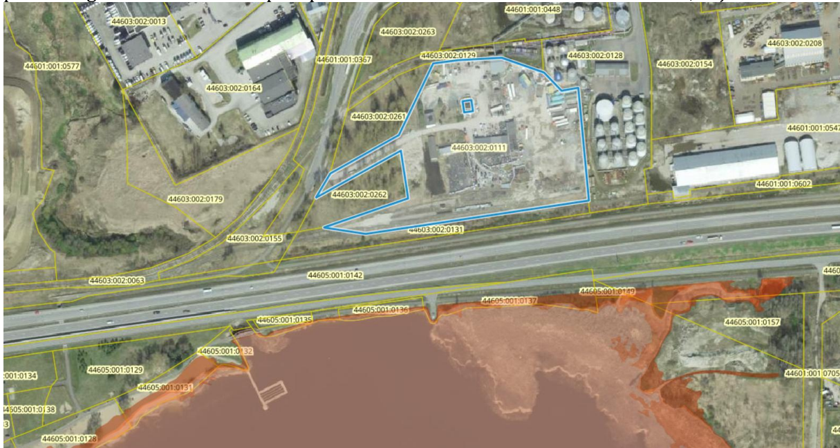
Joonis 1. Väljavõte Maa-ameti kaardirakendusest üleujutusohuga alade kaardist, punasega tähistatud Maardu järve üleujutusala prognoositav ulatus ja sinise joonega planeeringuala asukoht. Aluskaart: Maa-amet 2024.

Maa-ameti kaardirakenduse järgi ei asu planeeringuala üleujutuse alal, Maardu järv paikneb planeeringualast lõunas teisel pool põhimaanteed nr 1 Tallinn – Narva maantee, vt joonis 1.