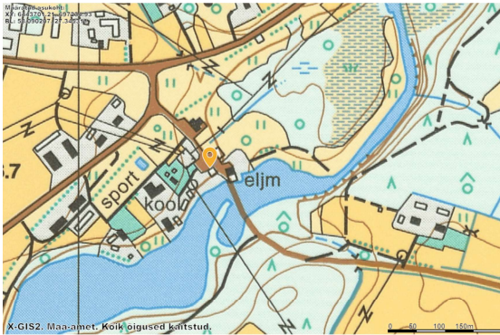
Väljavõte põhikaardist 1994...2020.