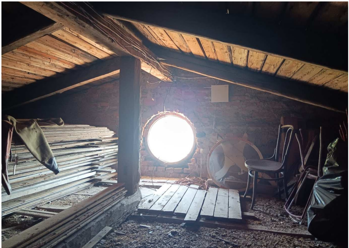
Fotod 10–20. Katusealune ja -konstruktsioon.