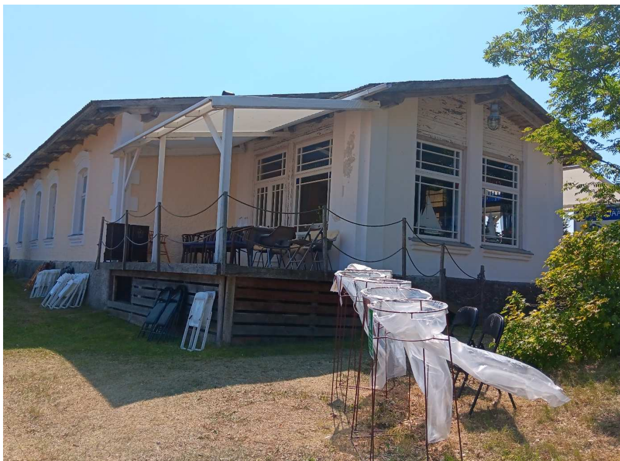
Fotod 6–7. Hoone läänepoolne otsafassaad.