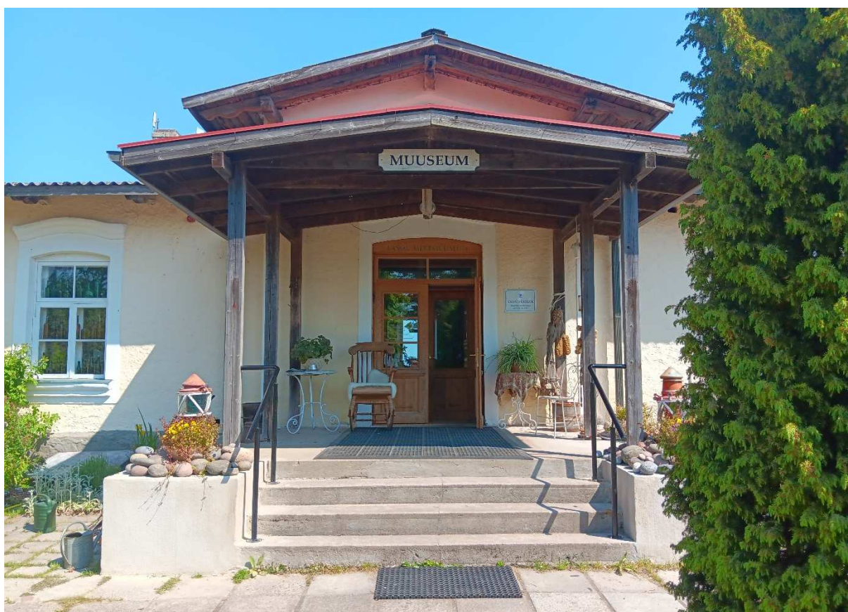
Foto 9. Peauks, varikatus ja esifassaadi poolne väljaehitus.