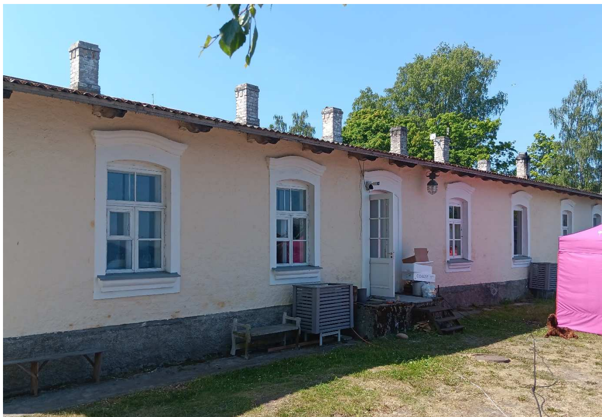
Foto 8. Hoone korstnad, vaade tagafassaadi poolt.