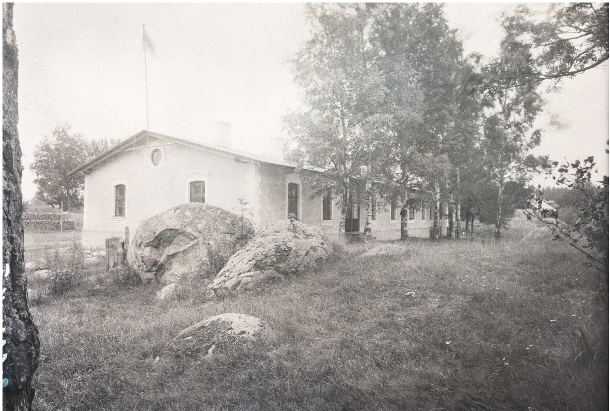
Foto 3. Käsmu kordonihoone, vaade idapoolsele otsafassaadile ja tagafassaadile u 1920-30.