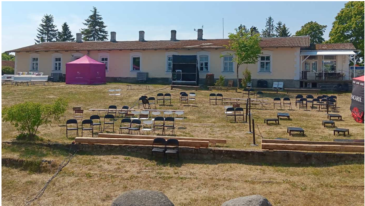
Foto 3. Hoone merepoolne tagafassaad.