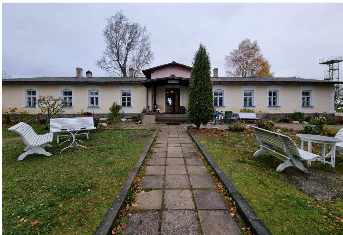
Foto 1. Hoone esifassaad.