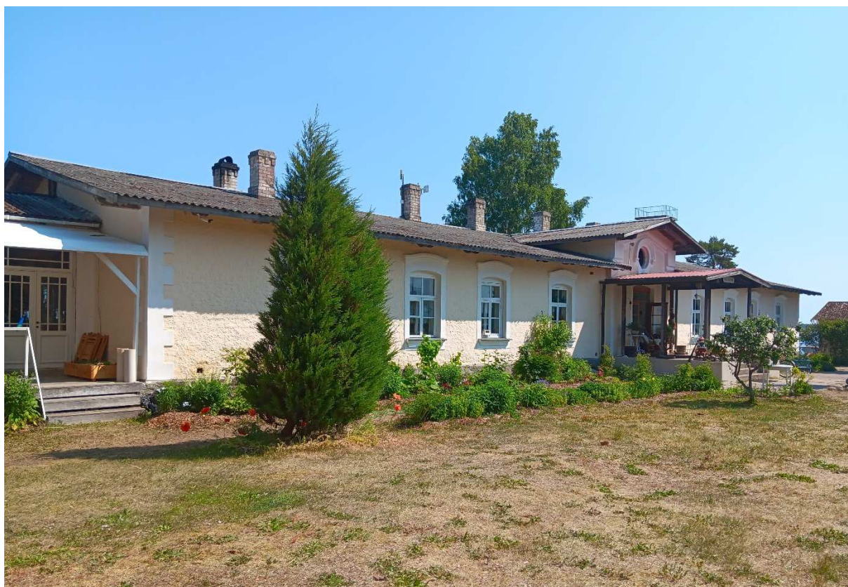
Foto 2. Hoone esifassaad, vaade läänest.