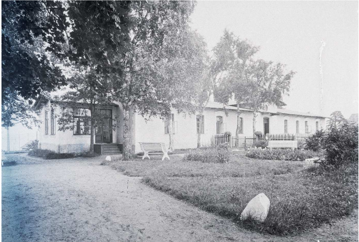
Foto 2. Käsmu kordonihoone, vaade esifassaadile u 1920-30. Allikas: Eesti Ajaloomuseum SA, AMN5641:161 (fotonegatiiv)