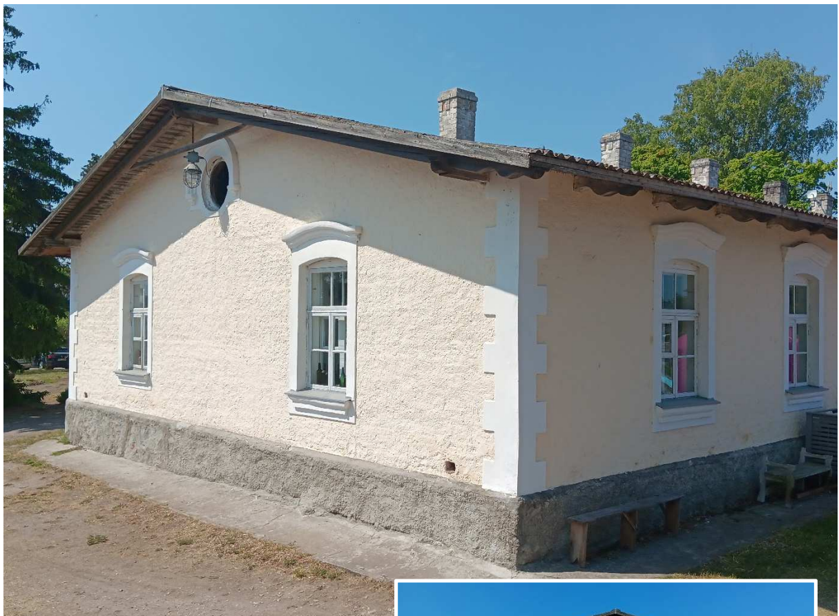
Fotod 4–5. Hoone idapoolne otsafassaad.