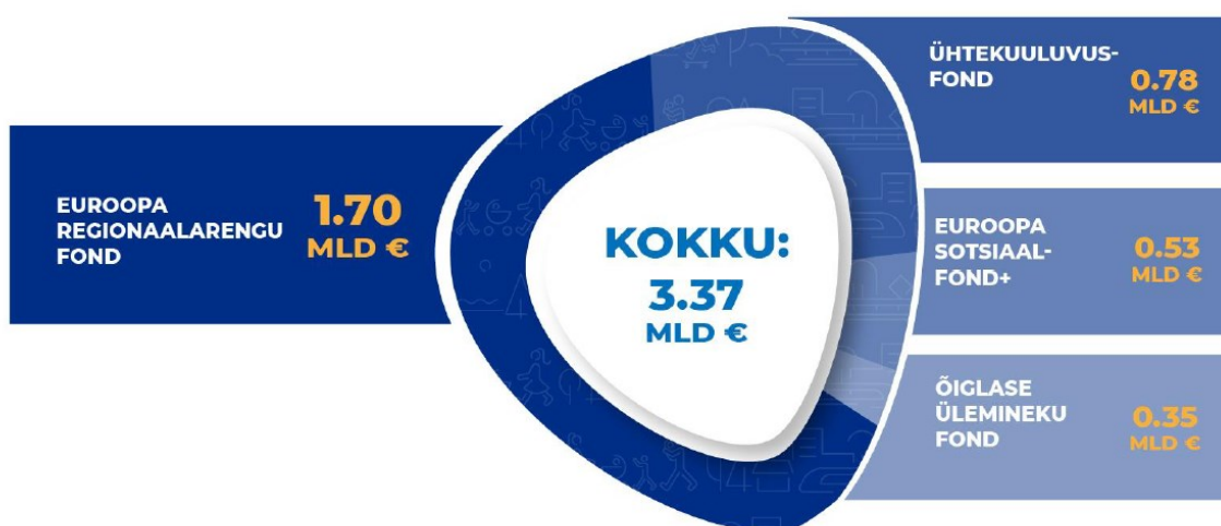
Joonis 2 Struktuurivahendite üldsumma ja jaotus perioodiks 2022-2027.

Euroopa Liidu struktuuritoetused on oluliseks ruumilise arengu tõukerahastuks, toetades algatusi erinevates valdkondades. Arusaam Euroopa Liidu eelisarendatavatest ja rahalist toetust saavatest valdkondadest aitab suurendada piirkonnale oluliste valdkondade arendamise tõenäosust. Ühtlasi võib toetusvaldkondade analüüsi pidada üheks osaks asjakohaste mõjude hindamisel, mille põhjal võimendada kaasnevaid positiivseid mõjusid. Praegusel hetkel on teada tõuketoetuste suurus, valdkonnad ja jaotamise põhimõtted perioodiks 2022-2027 (vt joonis 2)