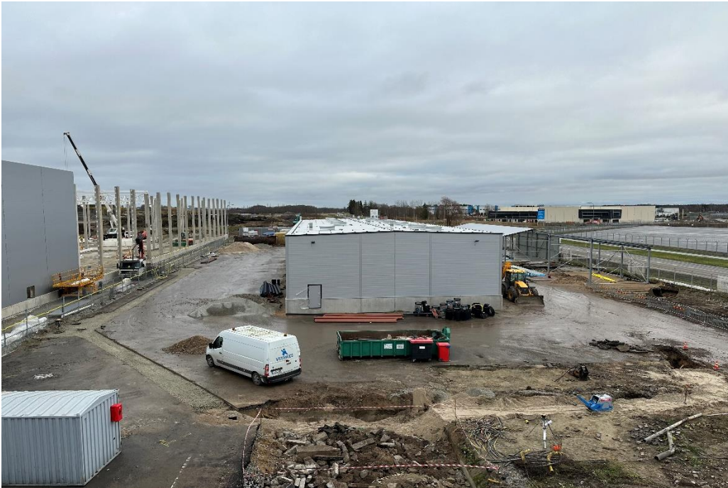
Pilt 1. Olukord Epleri kinnistul 13.11.24 seisuga (pildi keskel valmiv vastuvõtuhall/viilhall)