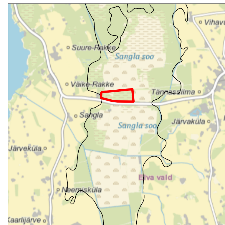
Kaardileht nr 543 Kolga-Jaani