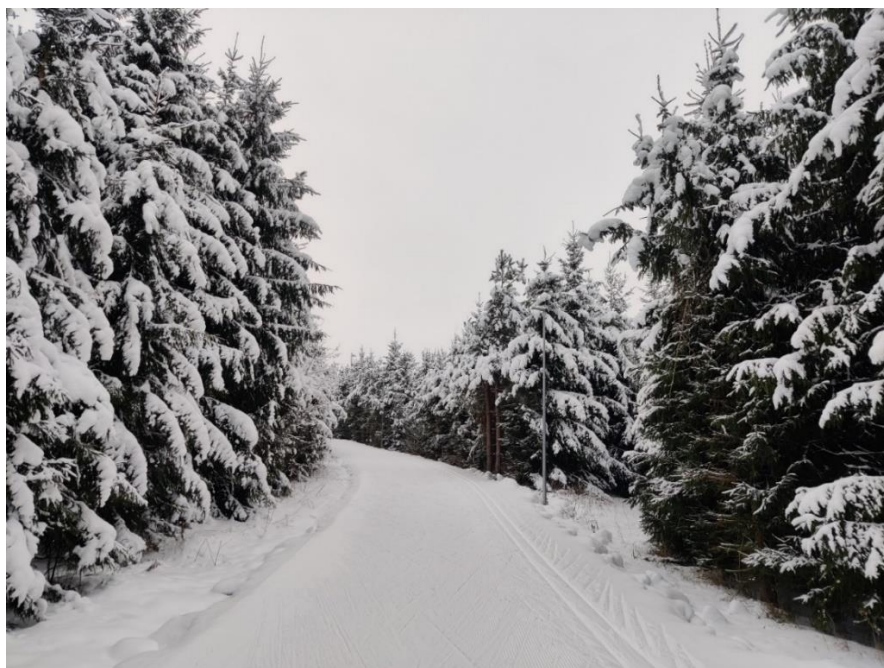
Foto 1. Vaade suusaradadele 2023. aasta detsembris.

Planeeringuala olemasolev olukord on toodud joonisel 3.