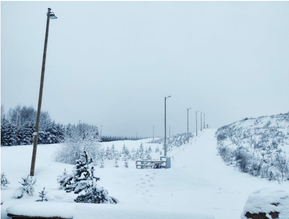
Foto 2. Vaade mäesuusa- ja lumelauamäele 2023. aasta detsembris.