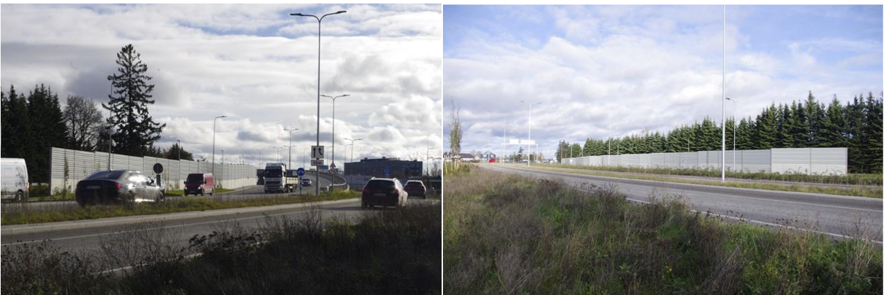
Müratõkkeseinad Tallinna-Tartu-Võru-Luhamaa tee ääres (Tartu linn, Tartu läänepoolse ümbersõidu II ehitusala)