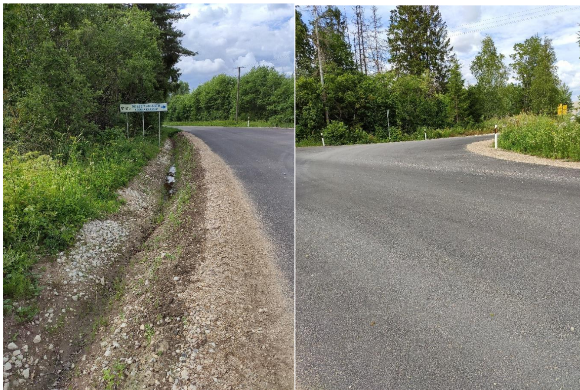
Vaated riigitee nr 16176 Vanamõisa-Koonga-Ahaste maantee ristmiku alale, kilomeeter 16.05

Projekteeritav truup asub Pärnu maakonnas, Lääneranna vallas, Koonga külas. Tegemist on „Eesti Killustik OÜ“ kinnistule suunduva, T-kujulise, ristmikuga. Kinnistul asub Koonga karjäär. Ristmik on asfaltkattega. Maantee servas kulgeb teekraav. Olevat olukorda illustreerivad all olevad fotod.