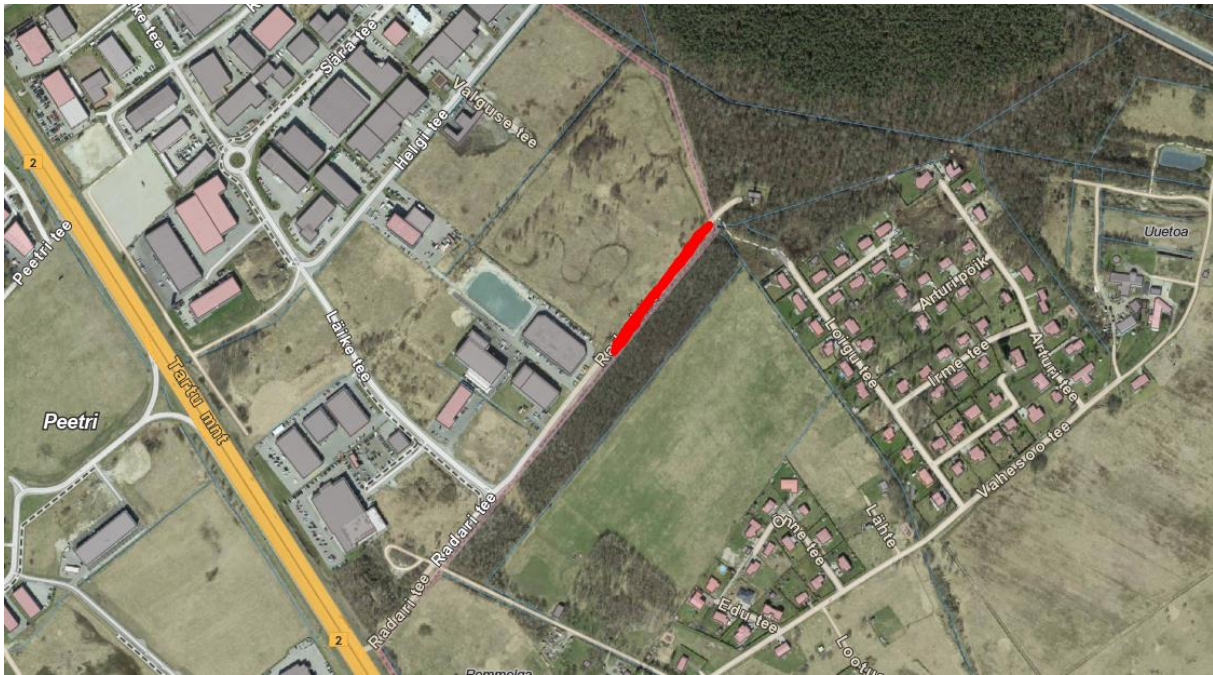
Skeem 2. Radari tee ehituse asukoht tähistatud punase värviga