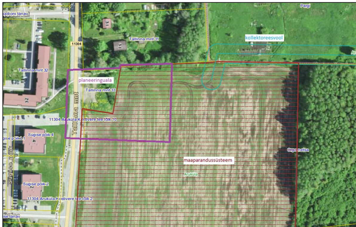
Skeem 3. Väljavõte maaparandussüsteemide andmete kohta Maa-ameti geoportaalist.