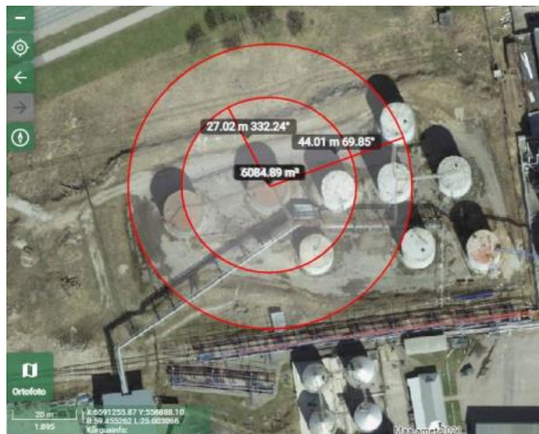
Joonis 6. Joonise märkus: Mahuti nr 5 koordinaadid L-EST süsteemis: X: 6591188.44, Y: 556868.17