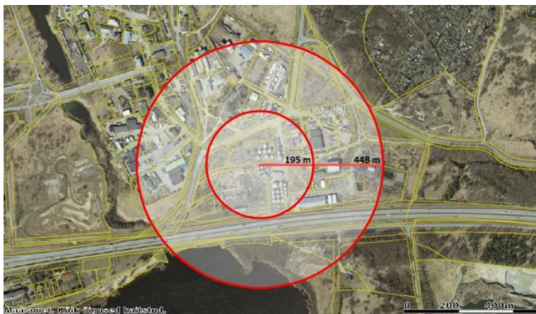
Joonis 2. Joonise märkus: Raudtee estakaadil koordinaadid L-EST süsteemis: X: 6591141.4, Y: 556888.4