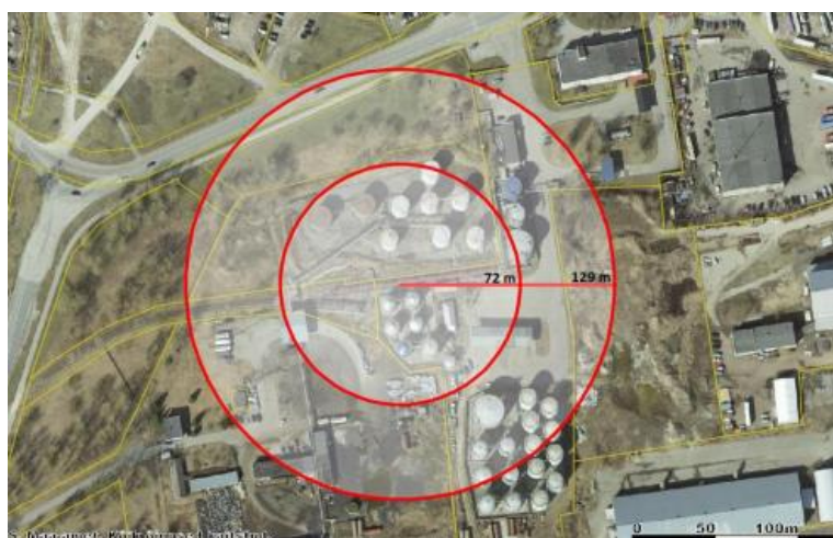
Joonis 1. Joonise märkus: Raudtee estakaadil koordinaadid L-EST süsteemis: X: 6591141.4, Y: 556888.4