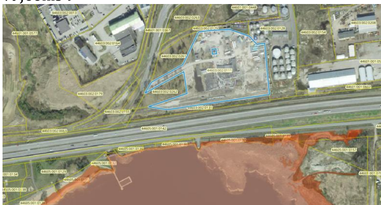
Joonis 9. Väljavõte Maa-ameti kaardirakendusest üleujutusohuga alade kaardist, punasega tähistatud Maardu järve üleujutusala prognoositav ulatus ja sinise joonega planeeringuala asukoht. Aluskaart: Maa-amet 2024.

Maa-ameti kaardirakenduse järgi ei asu planeeringuala üleujutuse alal, Maardu järve paikneb planeeringualast lõunas teisel pool põhimaanteed nr 1 Tallinn – Narva maantee, vt Joonis 9