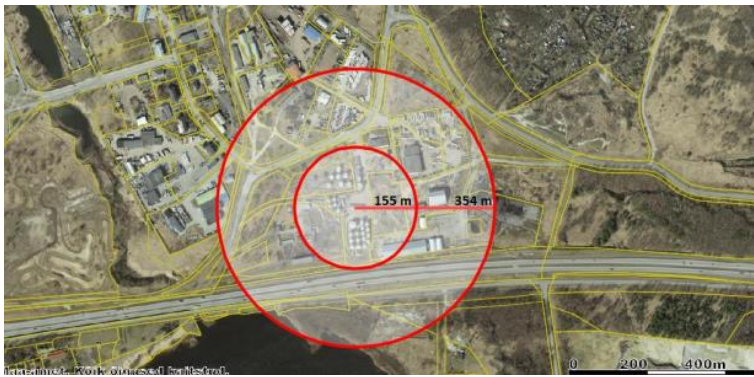
Joonis 4. Joonise märkus: Autode laadimisestakaadi koordinaadid L-EST süsteemis: X: 6591110.1, Y: 556949.5

Märkus: tulekera arvestuslik eksisteerimise aeg on 10s