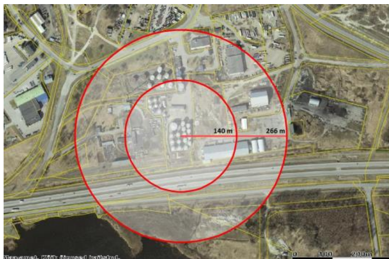
Joonis 7. Joonise märkus: Vallitusala nr 3 ja 4 koordinaadid L-EST süsteemis: X: 6591041.3, Y: 556960.6