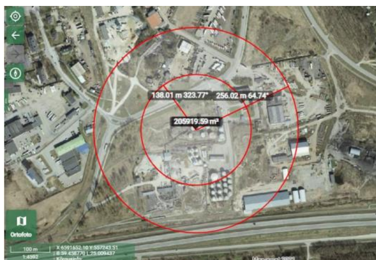
Joonis 8. Joonise märkus: Vallitusala nr 5 koordinaadid L-EST süsteemis: X: 6591181,43 Y: 556896,74

Planeeritavad hoonete tundlikkus tuleb valida vastavalt juhises välja toodud kooskõlastuse otsuse matriksi tabelile: