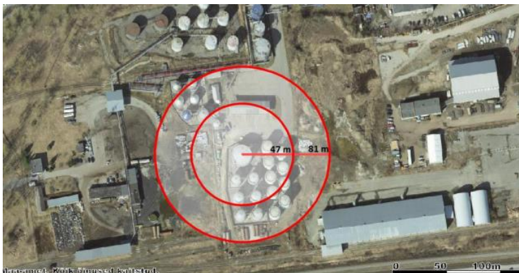
Joonis 5. Joonise märkus: Mahuti nr 17 koordinaadid L-EST süsteemis: X: 6591066.4, Y: 556942.6