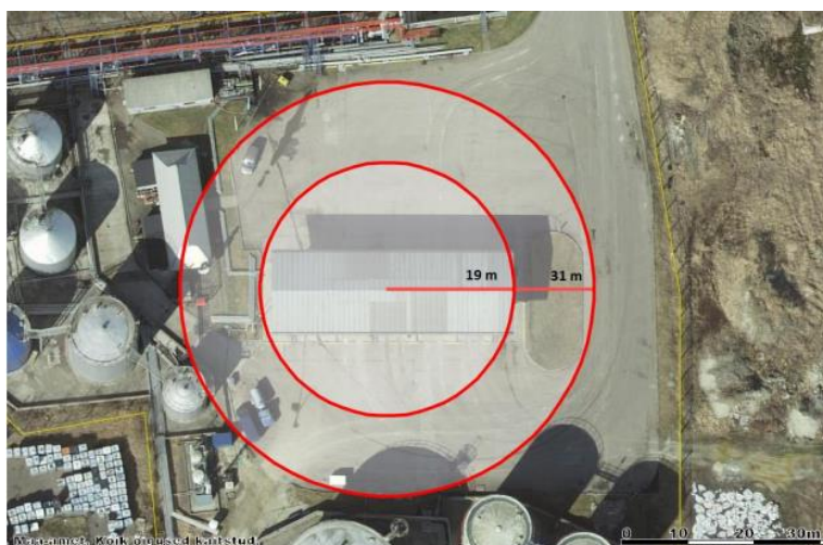
Joonis 3. Joonise märkus: Autode laadimisestakaadi koordinaadid L-EST süsteemis: X: 6591110.1, Y: 556949.5