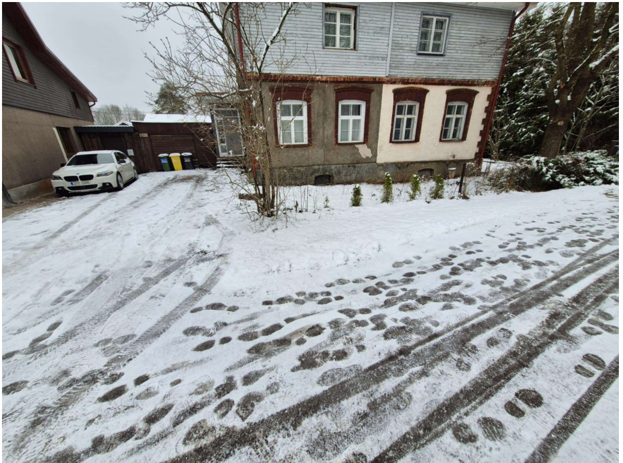
Foto 4, Vaade Tartu tänaval kaevetöödega kavandataval positsioonil

AS TREV-2 Grupp Reg. nr. 10047362 KMKR: EE100280335 03.12.2025