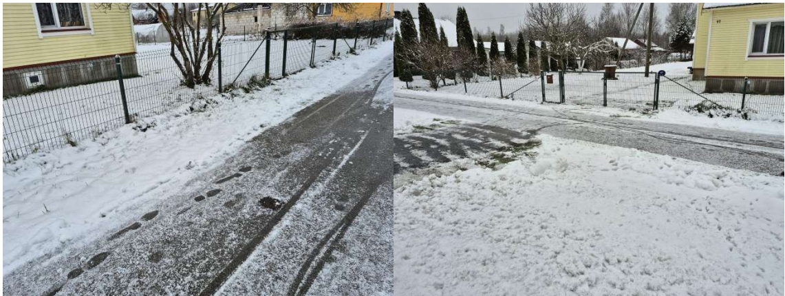
Fotod 2 ja 3. Vaade Aia tänaval kaevetöödega kavandataval positsioonidel