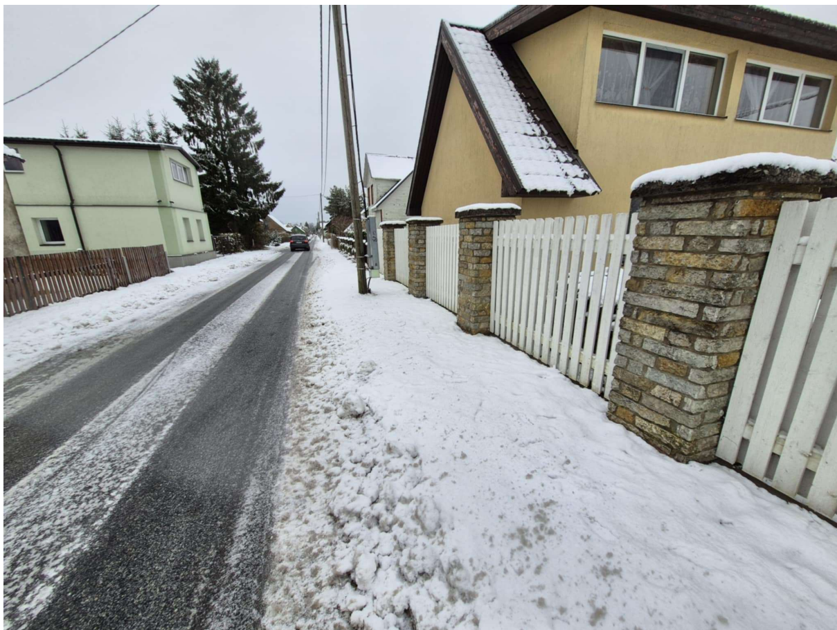
Foto 1, Vaade Pihkva tänavale ja selle sõiduteele kaevetööde positsioonil