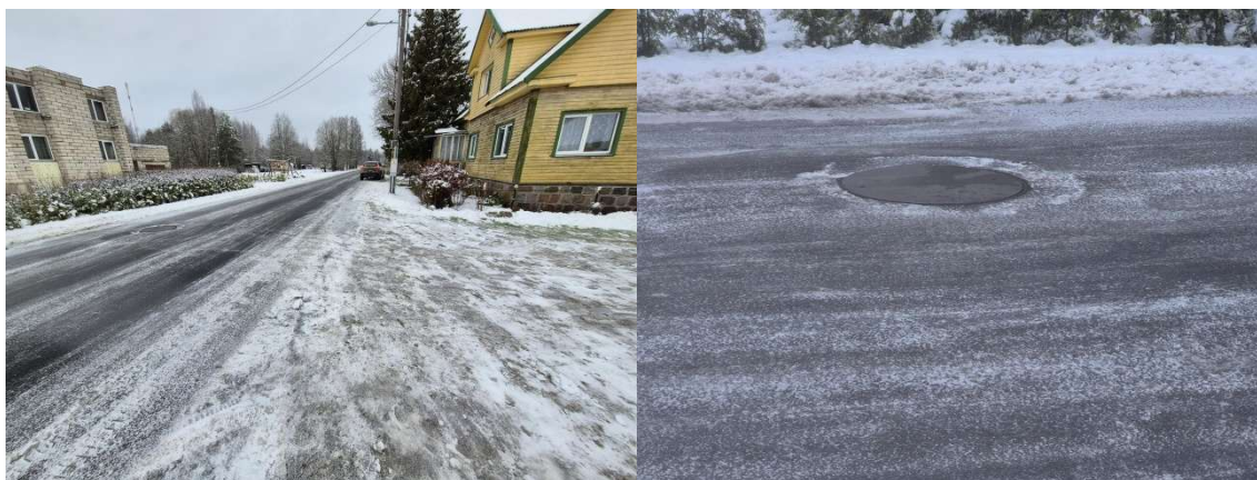
Fotod 5 ja 6, Vaade Narva tänaval kaevetöödega kavandataval positsioonil ja vaade Narva tänava veekaevule