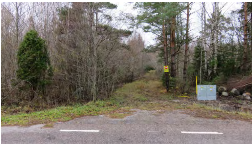
FOTO 6: Vaade Koidu maaüksuse juurdepääsuteele ja elektrikilpidele riigimaantee servast.