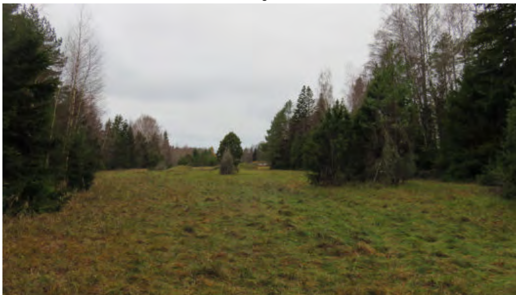
FOTO 3: Vaade Koidu maaüksuse rohumaale kirde nurgast edela suunal.