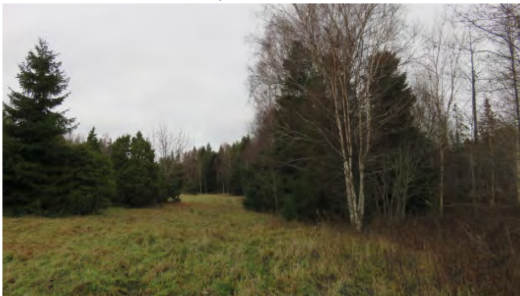
FOTO 2: Vaade Koidu maaüksuse rohumaale edela nurgast kirde suunal.