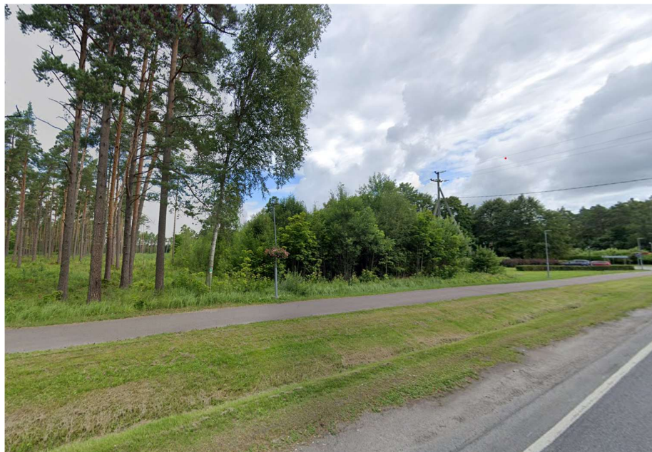
Pilt 1. Vaade planeeringualale Pärnu-Tori maanteelt.

Pohla katastriüksusel ei asu ehitisregistri andmete alusel olemasolevaid hooned.