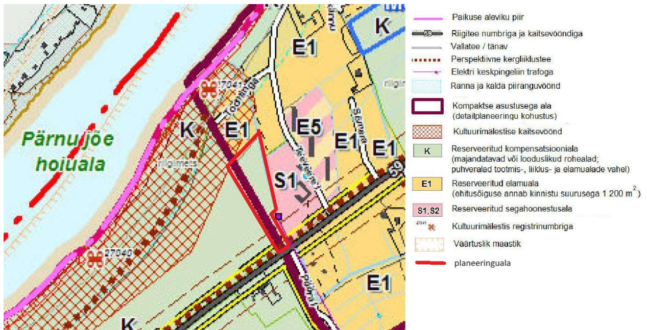
Skeem 3. Väljavõte „Paikuse valla üldplaneeringu“ kaardist „Keskused“. Planeeringuala on tähistatud punase kontuuriga.

Planeeringuala paikneb kehtiva „Paikuse valla üldplaneeringu“ (kehtestatud Paikuse Vallavolikogu 15.06.2009 määrusega nr 8) „Keskused“ kaardi kohaselt detailplaneeringu koostamise kohustusega kompaktse asustusega alal oleval K- reserveeritud kompensatsioonialal (majandatavad või looduslikud rohealad, puhveralad tootmis-, liiklus ja elamuvalade vahel), vaata Skeem 3.