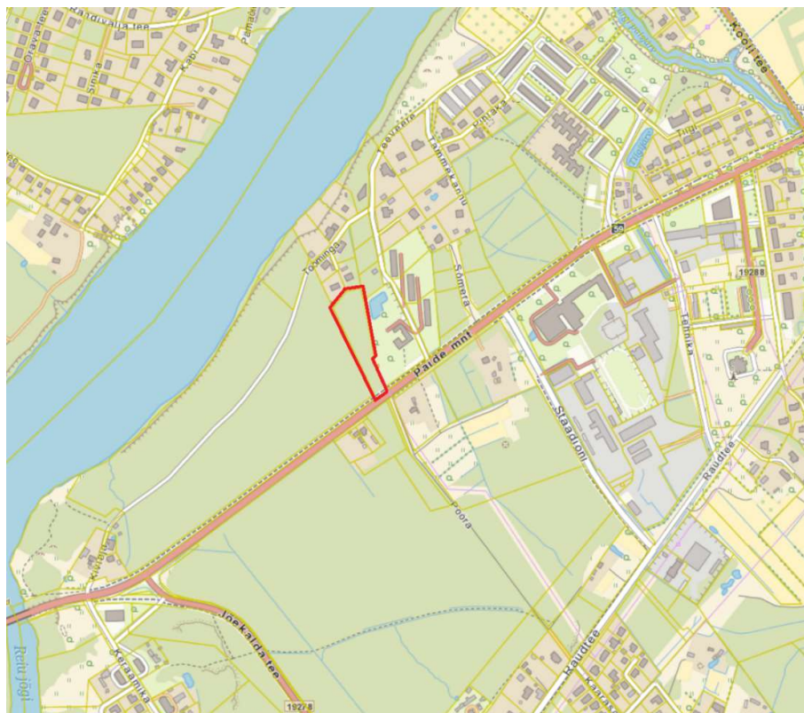
Skeem 1. Väljavõte Maa-ameti kaardirakendusest. Planeeringuala on tähistatud punase kontuuriga.

Planeeringuala asub Pärnu maakonnas Pärnu linnas Paikuse alevis ning hõlmab eraomandis olevat Pohla (56801:001:1293, pindala 8575.0 m 2 ) katastriüksust. Planeeringuala jääb Pärnu jõest ca 170 m kaugusele, Sindi linnapiirist ca 2 km kaugusele ja Pärnu kesklinnast ca 6 km kaugusele (vaata Skeem 1 ).