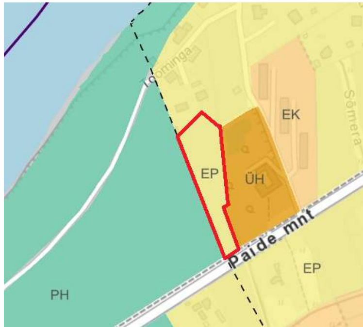
Skeem 4. Väljavõte koostatavast „Pärnu linna üldplaneering 2035+“ kaardirakendusest. Planeeringuala on tähistatud punase kontuuriga.

Koostatav üldplaneering määrab Paikuse alevi keskuse-arengualale tingimused nii olemasoleva olukorra jätkumisel kui ka arenguvõimaluste rakendamisel senise maakasutuse muutmise korral. Arendustegevuse pikaajalisem eesmärk on piirkonna kujundamine tänapäevaseks linnakeskuseks koos kvaliteetse ja kasutajasõbraliku linnaruumiga, lisaks tootmistegevuse järkjärguline väljaviimine ja äri-, teenindus-, ühiskondliku- ja elamisfunktsiooni arendamine.