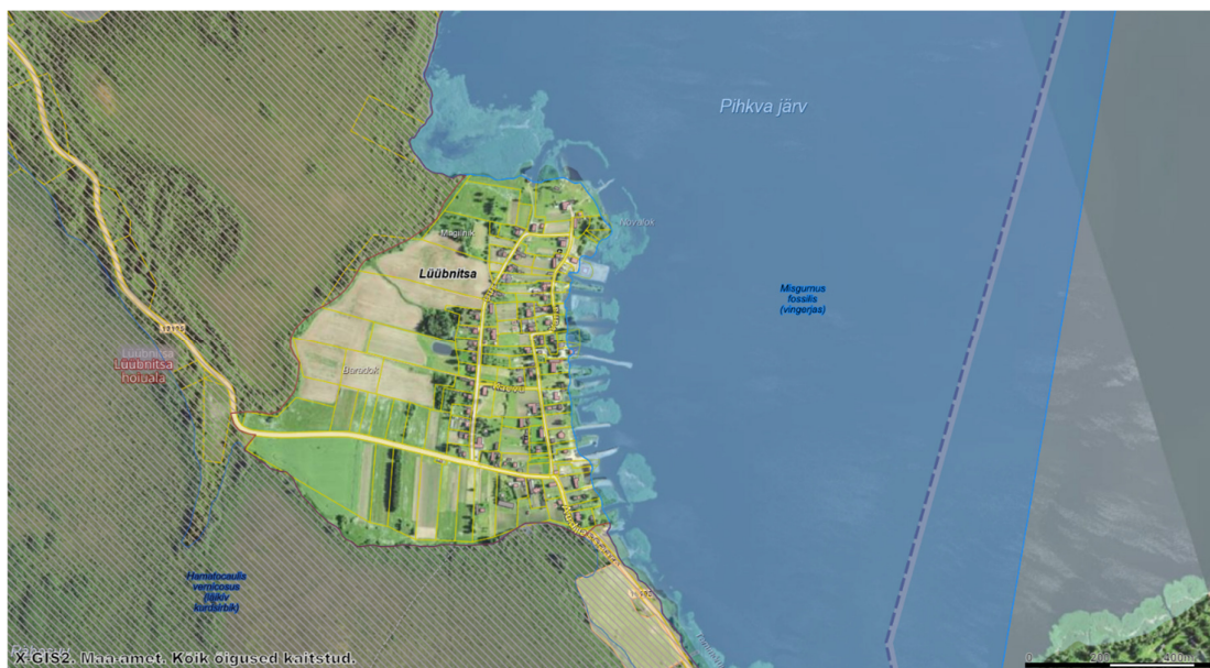
Skeem 1. Kaitstavad loodusobjektid

III kaitsekategooriasse arvatakse nii liigid, mille arvukust ohustab elupaikade ja kasvukohtade hävimine või rikkumine ja mille arvukus on vähenenud sedavõrd, et ohutegurite toime jätkumisel võivad nad sattuda ohustatud liikide hulka.