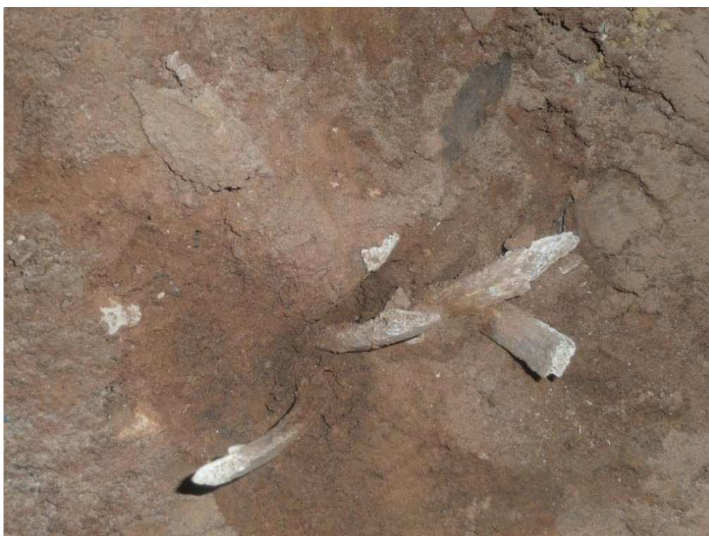
Foto 2. Roided.