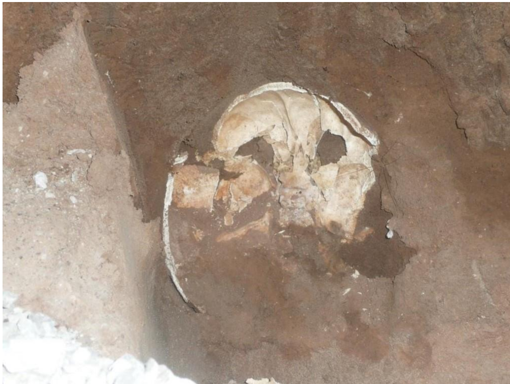
Foto 1. Kolju.

Lisa 2. 2009. aastal Võõpsu alevikus maantee rekonstrueerimise käigus ilmnenu inimluud.