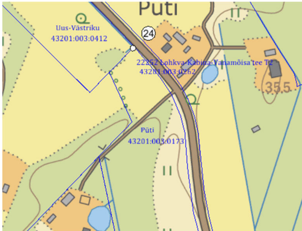
Piiripunkti nr. 24 asukoht Uus-Västriku katastriüksuse plaani koordinaatide järgi