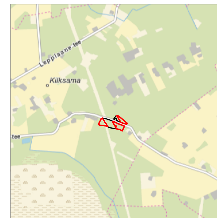
Kaardileht nr 5334 Pärnu-Jaagupi