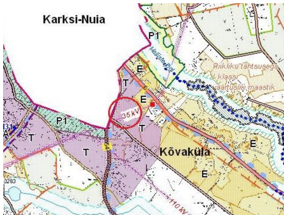
Skeem 1. Väljavõte Karksi valla üldplaneeringu põhijoonise kaardist. Põhiotstarbed: E – elumuala, T – tootmisala, P1 – puhkeala hoonete ehitamise õigusega, S – segahoonestusala.

Üldplaneeringu põhijoonise järgselt on käesoleva detailplaneeringuga käsitletava planeeringuala põhiotstarbeks määratud „Tootmisala“, Üldisi maa-ala ehitustingimusi üldplaneering käesoleva detailplaneeringu planeeritaval maa-alal ei sea.