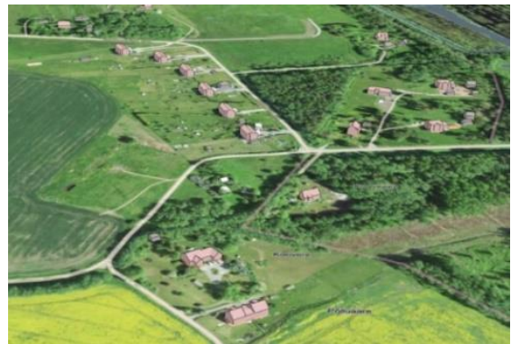
Lähiümbruse hoonestus_väljavõte maa-ameti 3D kaardirakendusest ( https://3d.maaamet.ee/kaart/ )

Lubatud maksimaalne hoonete ehitisealune pind kokku on 400 m 2 (sh elamu pindalaga kuni 240 m 2 ).