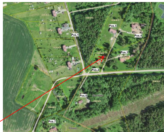
Planeeritav Kaulaane kinnistu

Planeeritaval kinnistul asuv kuur on ette nähtud lammutada.