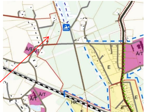
Planeeritav Kaulaane kinnistu

Hajaasustuslalal, kus ei ole juhtostarvet määratud, on perspektiivis lubatud kõik katastri sihtotstarbed kui need sobivad piirkonda ja kavandatav tegevus lähtub üldplaneeringus etteantud tingimustest. Seega ei ole tegemist üldplaneeringut muutva detailplaneeringuga.