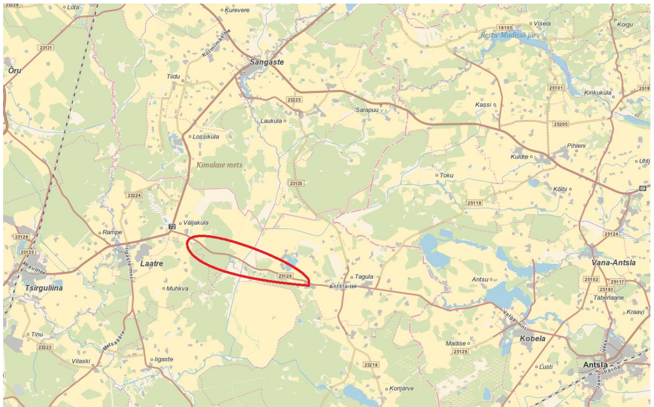
Joonis 1. Projekteeritud elektrivõrkude asukoht: Puka alevik ja lähiümbus, Otepää vald, Valga maakond.