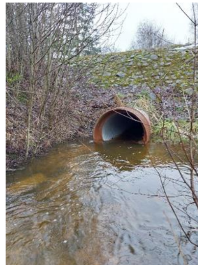
Truubi vaated allavoolu ja pealevoolu veebruaris 2025.

Truubi läbilaskevõime arvutamiseks kasutame Manningi valemit: