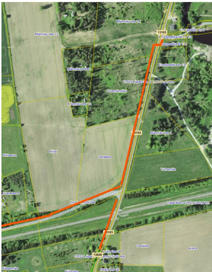
Lisa 1: Transpordiameti ettepanek JJT trassi ja teeületuse võimaliku asukoha osas

Käesolevad nõuded on projekti lahutamatu osa, mis kehtivad 2 aastat allkirjastamise kuupäevast.