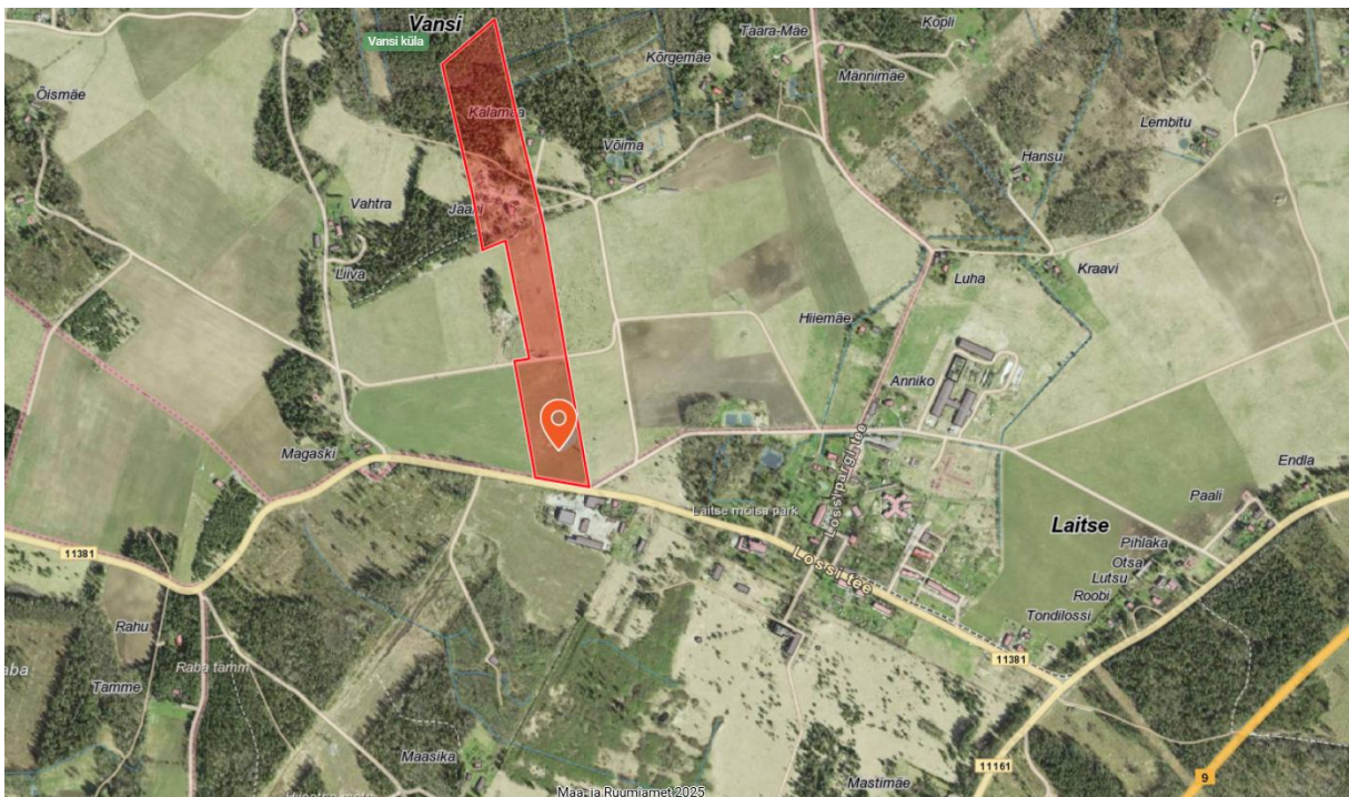
Joonis 1. Jaani kinnistu juurdepääsutee asukoht (1)

Kinnistu juurdepääsutee asukoht on näidatud alljärgnevatel skeemidel (Joonis 1, Joonis 2).