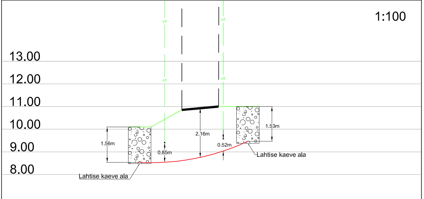
Ristumine 21147 Saikla - Tumala teega km-I 1,24