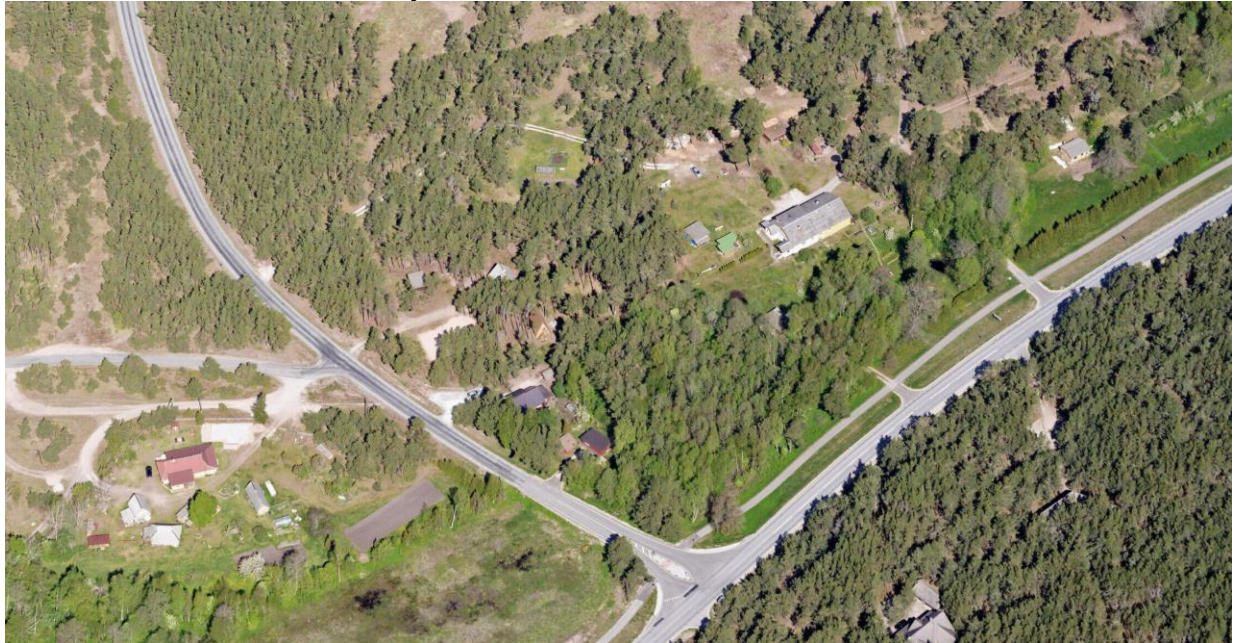
Joonis 2 Maa-ameti Fotolao väljavõte

Detailplaneeringuga kavandatud hoonestus sobib piirkonna maakasutuse ja hoonestuslaadiga