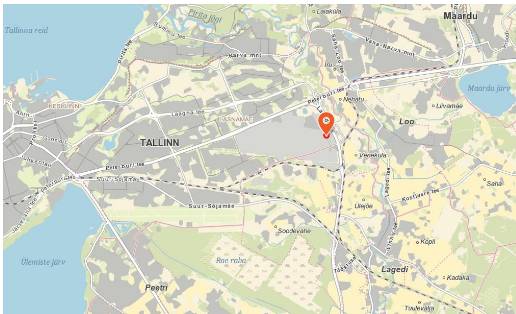
Joonis 1. Objekti asukoht (üldskeem)

Riigiree nr 3857, Veneküla ring, km 0,012 – 0,03.