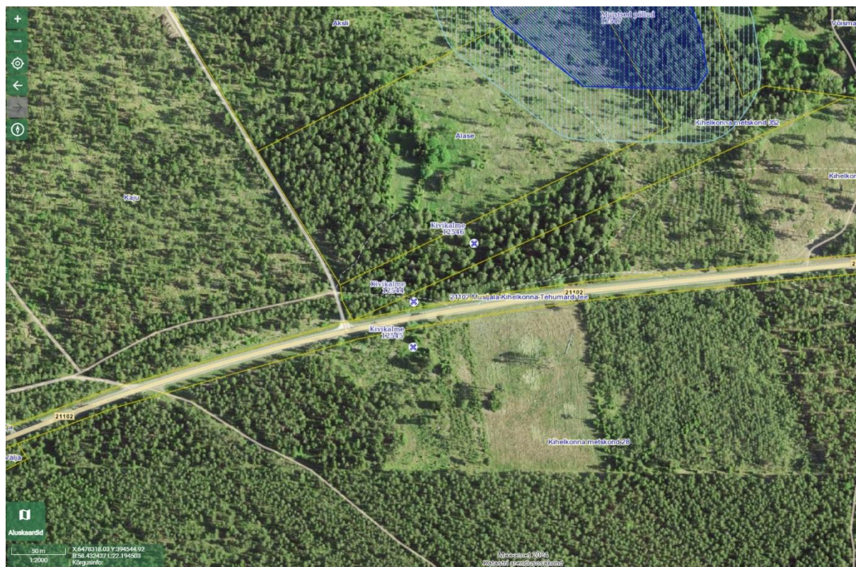
Lisa 1. Kivikalmete reg-nr 12544–12546 asukohad (sinised punktsümbolid) Maa-ameti kultuurimälestiste kaardikihil seisuga 30.01.2024. (Alus: Maa-ameti geoportaali kultuurimälestiste kaardikiht)