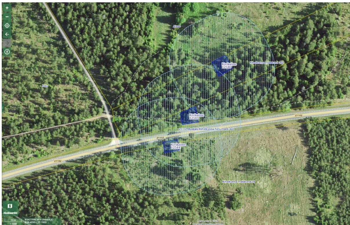
Lisa 3. Kivikalmete reg-nr 12544–12546 asukohad, ruumikujud ja kaitsevööndid Maa-ameti kultuurimälestiste kaardikihil seisuga 12.02.2024. (Alus: Maa-ameti geoportaali kultuurimälestiste kaardikiht)