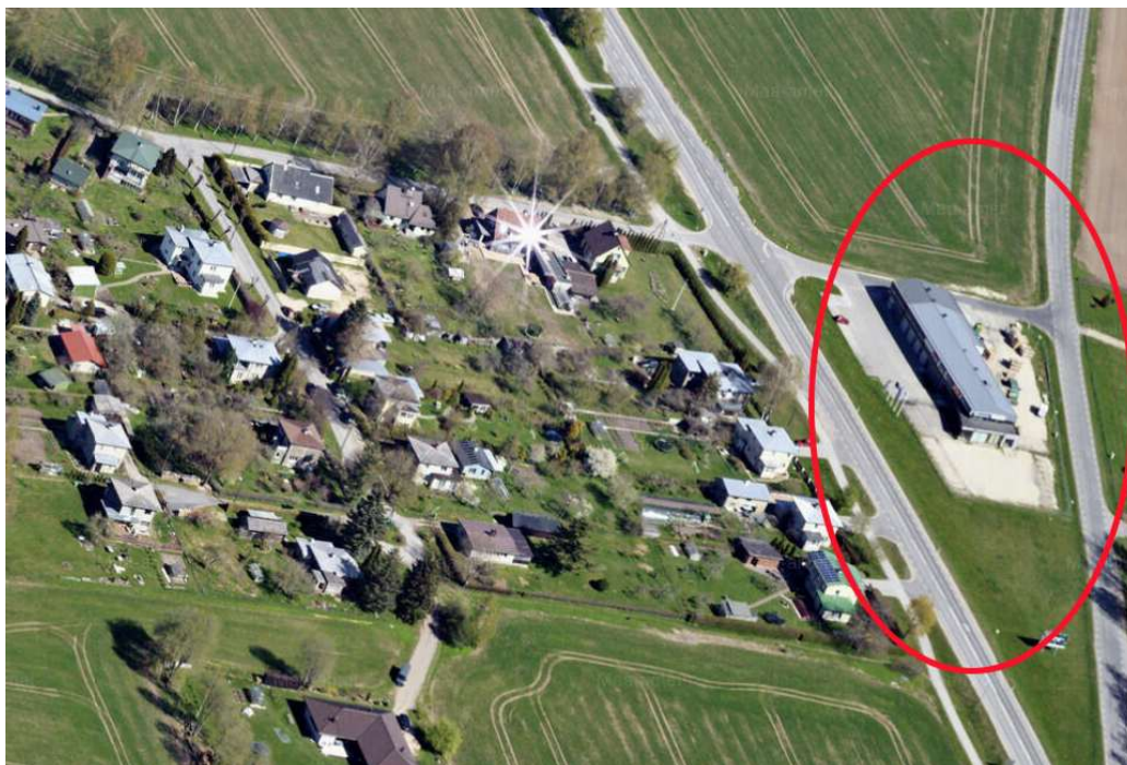
Foto: 1 Planeeringuala asukoht.

Detailplaneeringuala asub Peetrimõisa külas katastriüksustel 71501:002:1340 (Karula tee 2 // Tallinna tn 88). Katastriüksuse sihtotstarve on ärimaa. Varem koostatud detailplaneeringud samal alal puuduvad.