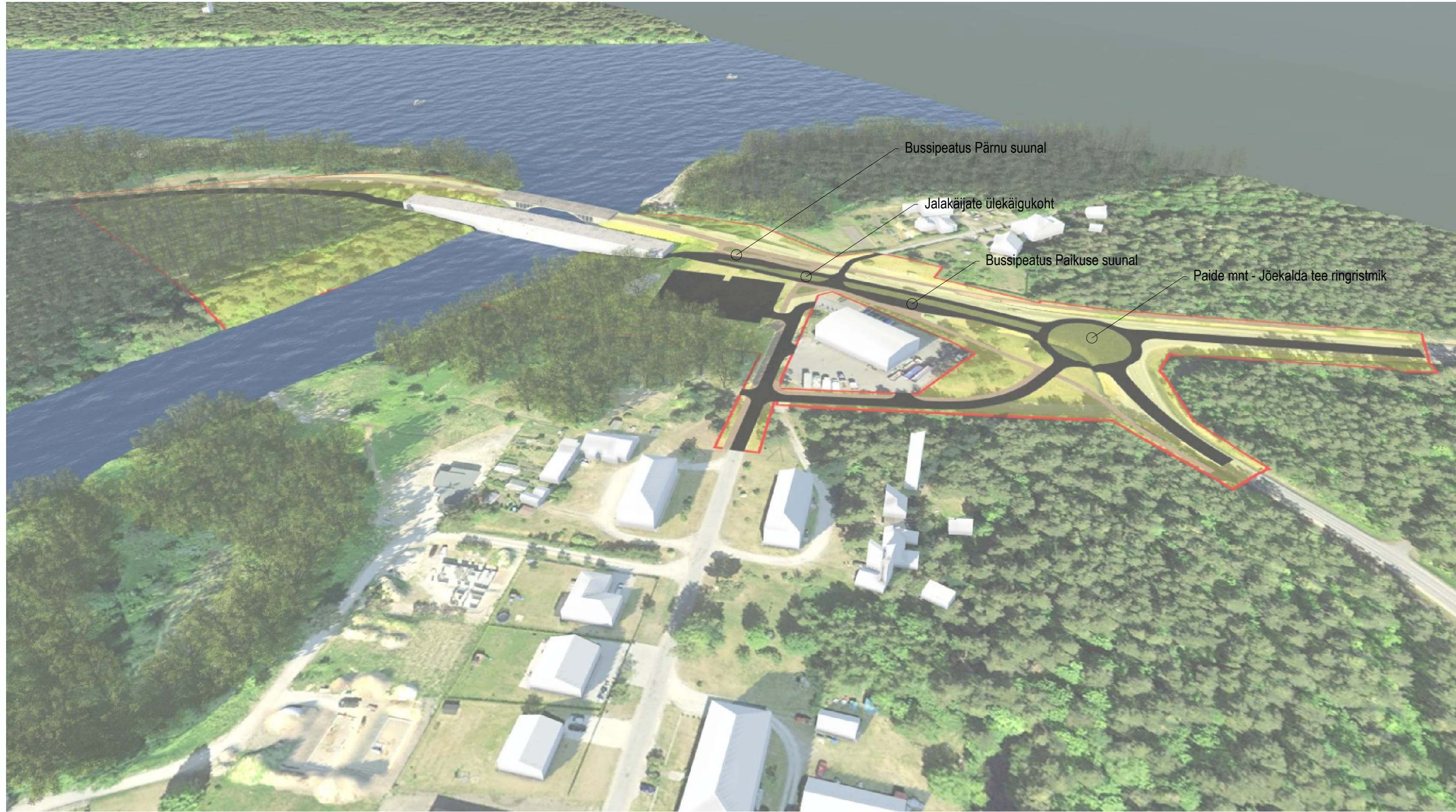
Vaade Paikusele Lodja tiigi poolt