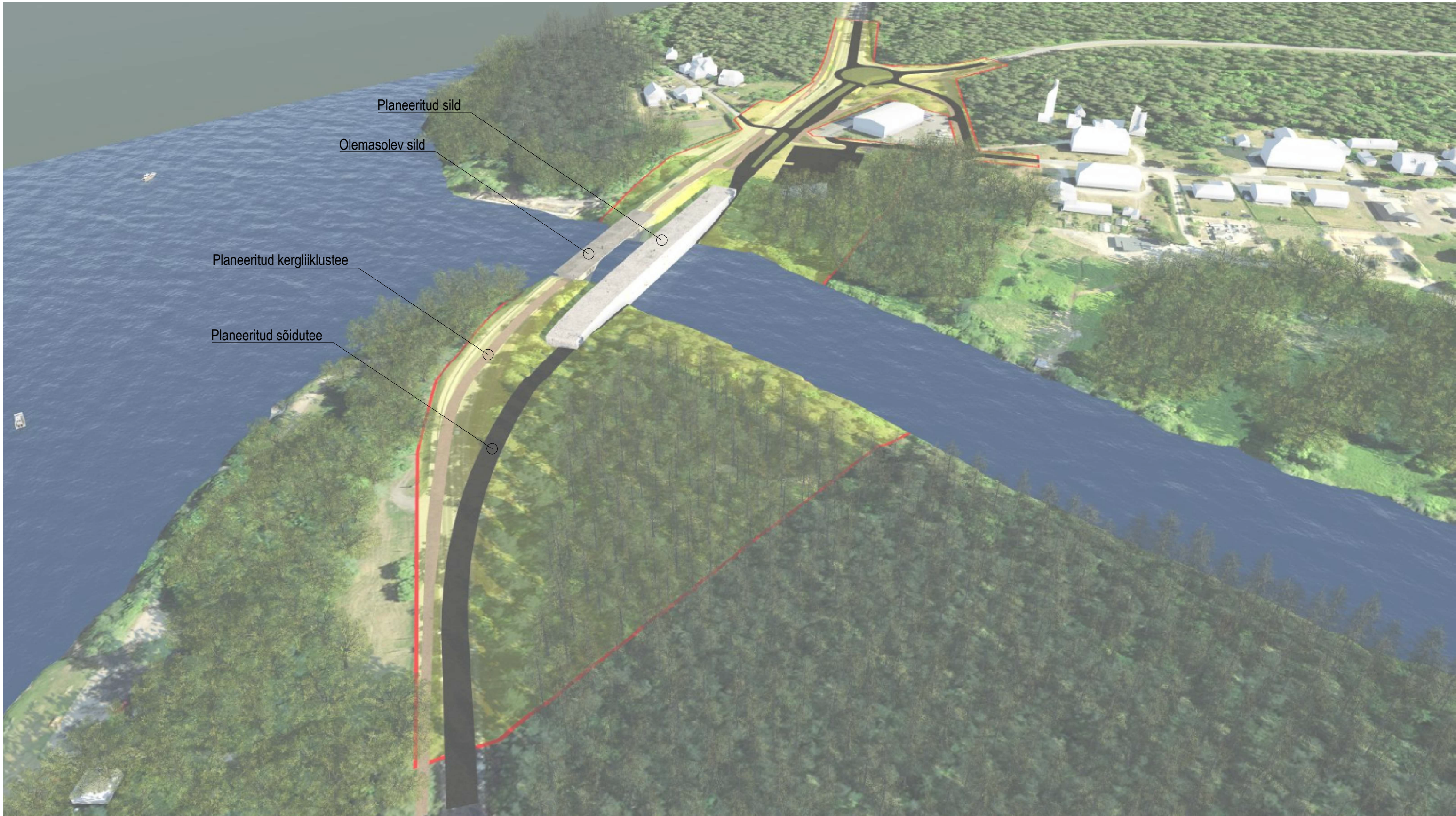
Vaade Pärnu poolt Paikuse suunas