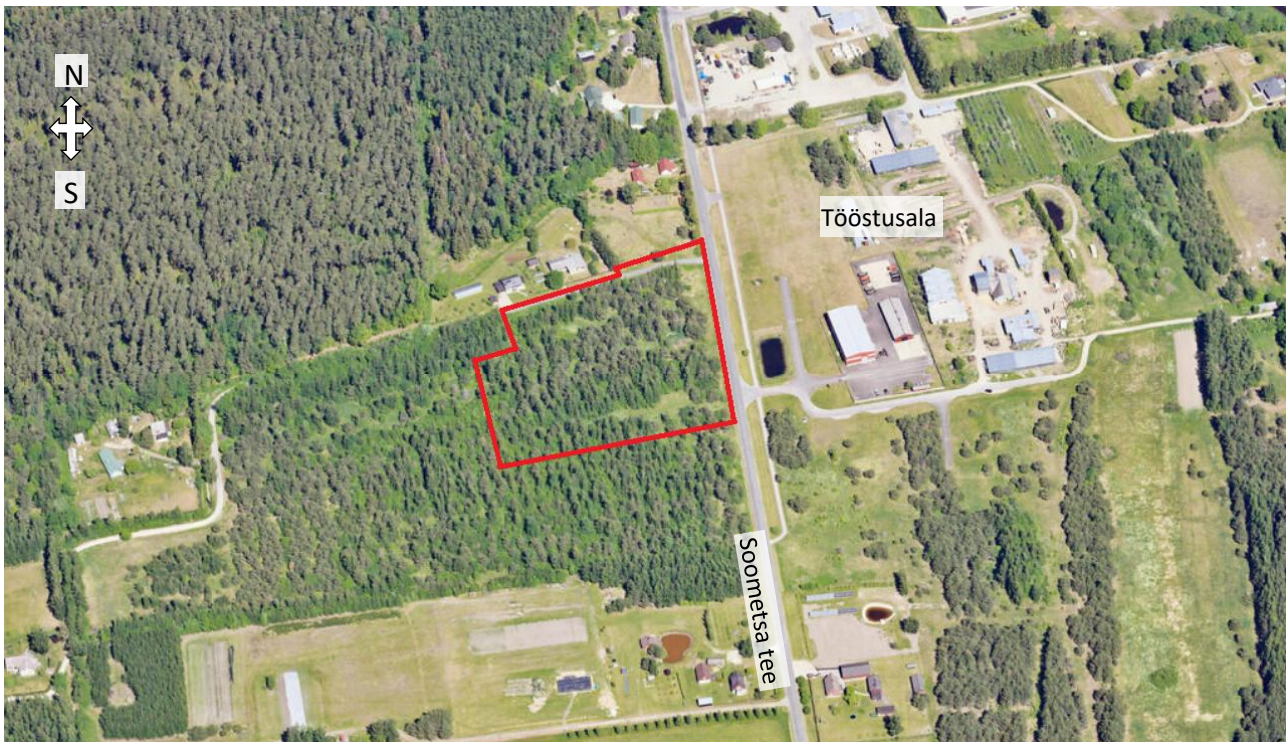
Skeem 1. Vaade planeeringualale lõunast. Planeeringuala on tähistatud punase joonega.

ehitisregistris puudulik, kuid hinnanguliselt on hoonete kõrgus alla 10 m. Planeeringuala paiknemist mõjualas illustreerib skeem 1.