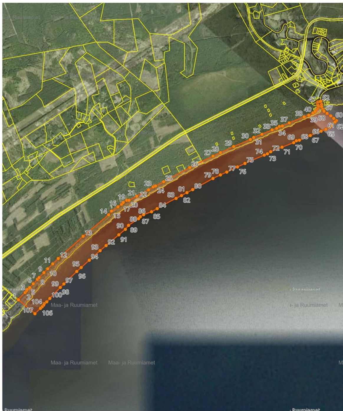
Kaart 2. Arheoloogilise leiukoha piir.